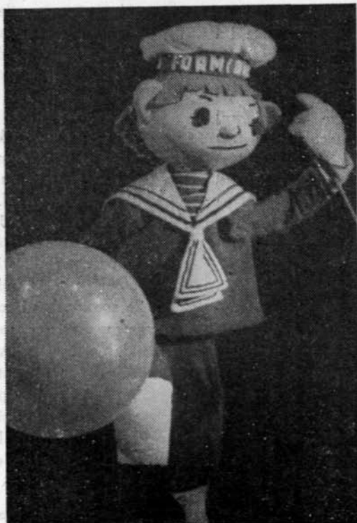
Domnul Goe (Teatrul de păpuși din Craiova)

Marele nostru Caragiale a fost prezent și la sărbătoarea teatrelor de păpuși, oferind colectivului craiovean materialul savurosului spectacol Domnul Goe . Personajele schiței lui Caragiale, caracterizate lapidar de autorul lor, s-au dovedit apte de a căpăta formă și consistență materială în teatrul de păpuși, unde s-au întîlnit cu alte cîteva fapte ale marelui comediograf, ca Cetățeanul turmentat sau Ghiță