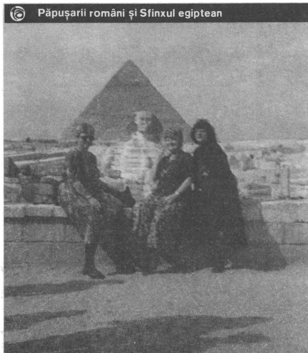
Păpușarii români și Sfinxul egiptean