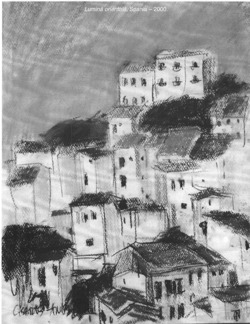
Lumină orientală, Spania – 2000.

vioiciunea tinerească a privirii, ne îndeamnă să redescoperim un teritoriu al ingenuității și al tihnei sufletești, într-o lume și un timp pândite de egoism, violență, îndoieli, trădări și schisme ce își fac nedorita prezență chiar și în sanctuarul artei.