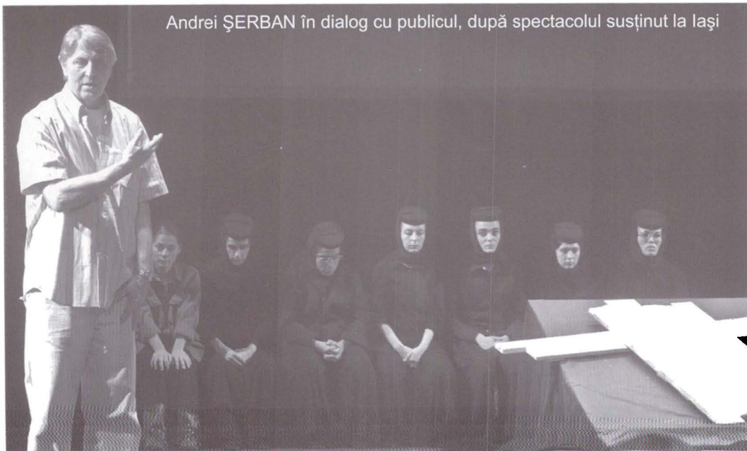
Andrei ȘERBAN în dialog cu publicul, după spectacolul susținut la Iași

Andrei Șerban: Acum vă dăm cuvântul. Avem o experiență destul de bogată, de a pasa microfonul la cine ridică mâna în sală. Cel mai greu e pentru cine începe, apoi lucrurile se încălzesc și toată lumea vrea să spună ceva.