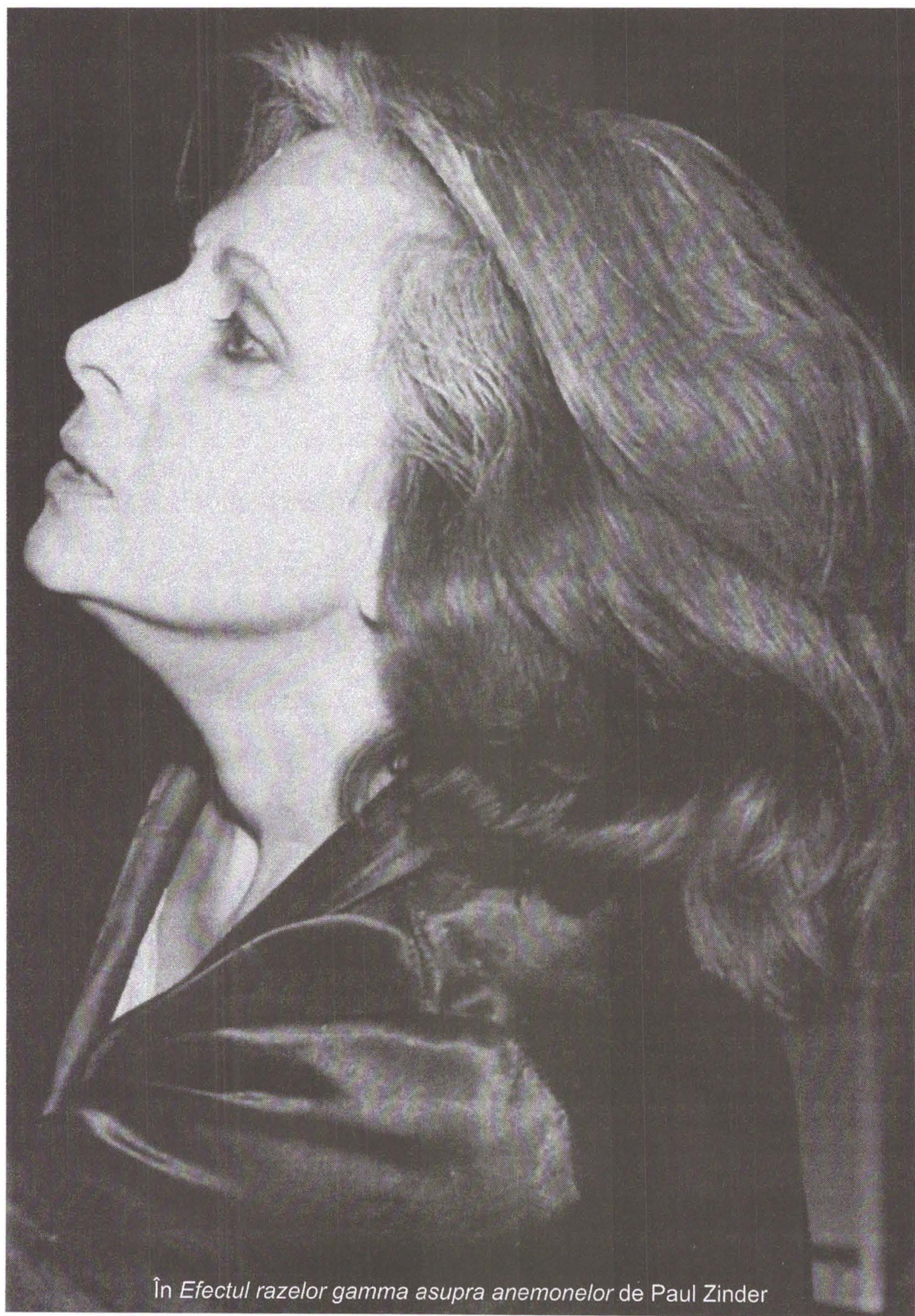
În Efectul razelor gamma asupra anemoneilor de Paul Zinder