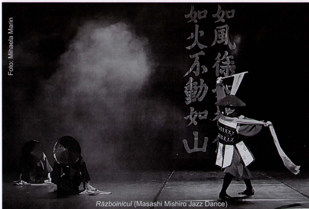
Războinicul (Masashi Mishiro Jazz Dance)

am impresia că, din spatele meu, cineva mă privește?”, „De ce personajele din tablourile lui Vermeer se află întotdeauna lângă o fereastră?”, „De ce natura și oamenii sunt mult mai frumoși în tablouri decât în realitate?”, „Prin ce diferă privirea pictorului față de aceea a omului obișnuit?”. Multe dintre aceste gânduri îmi află apoi o subtilă intertextualitate cu acelea din Micul Prinț , de Saint-Exupéry, unde vulpea îi mărturisea protagonistului că „lucrurile cele mai profunde se văd cu inima, nu cu ochii”. Acest unic text contemporan japonez de pe scena Festivalului sibian, prezentat apoi la Facultatea de teatru din Craiova și la Teatrul „Nottara” din București, a cunoscut o expresie scenică de o provocatoare simplitate, în care profunzimea cuvântului era permanent concuroasă de tăceri grele de întrebări, de substanță emoțională. Impresiile produse de spectacol au fost completate la Sibiu de o amplă conferință a domnului Oriza Hirata despre teatrul contemporan japonez, iar în Capitală de un simpozion inițiat cu sprijinul Ambasadei Japoniei la București și al Universităților din București și Craiova, dedicat rolului important al dramaturgiei acestui reputat om de teatru în evoluția artei spectacolului și a învățământului din Țara Soarelui Răsare.