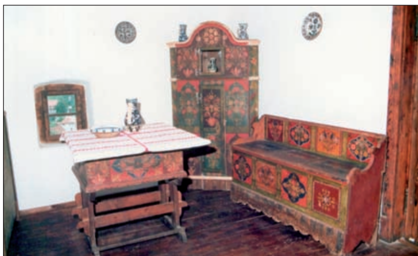
Fig. 4 - Mobilier sășesc pictat, zona Rupea, Transilvania, mijlocul secolului al XIX-lea. Furniture painted by Saxon craftsmen, Rupea area, Transylvania, mid-19th Century.