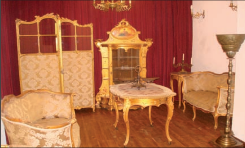
Fig. 5 - Mobilier în stil neorococo, atelier August Bembé, Mainz, sfârșitul secolului al XIX-lea Neo Rococo furniture, August Bembe workshop, end of 19th Century.