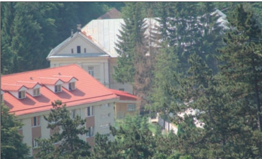
Fig. 6 - Casa mare, astăzi – sediul Unității Militare 0458. The “big house”, today – the headquarters of the Military Unit 0458.