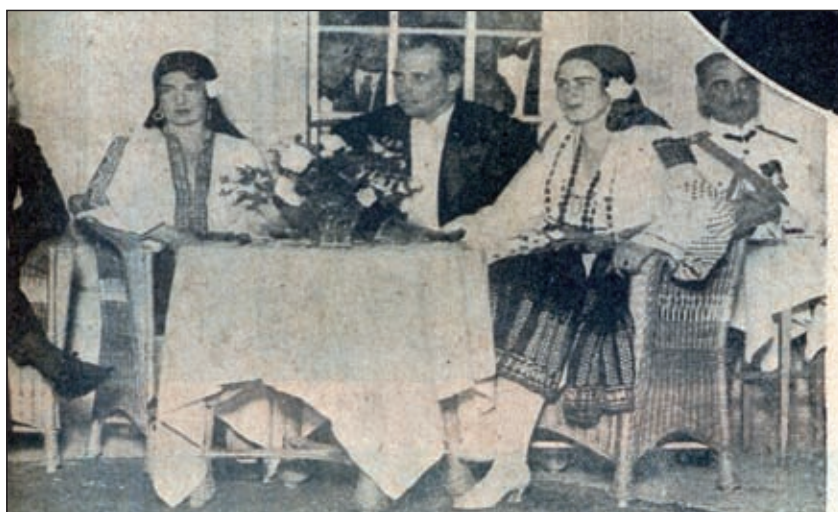
Fig. 2 - Prințesa Ileana a României și arhiducele Anton de Habsburg la o serbare a Asociației Creștine a Femeilor. Imagine publicată în Ilustrațiunea Română , 24 iunie 1931. Princess Ileana of Romania and archduke Anton of Habsburg at a celebration of the Association of the Christian Women. Image published in "Ilustrațiunea Română", June 24th, 1931.