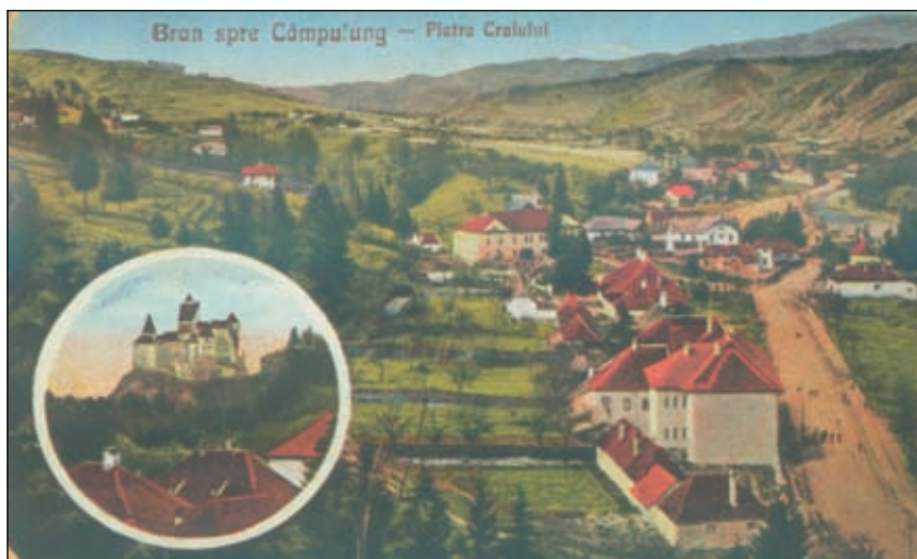
Fig. 1 - Casa mare în perioada interbelică (carte poștală ilustrată din colecția dr. Emil Stoian). The "big house" during the interwar period (picture postcard from the collection of Dr. Emil Stoian).