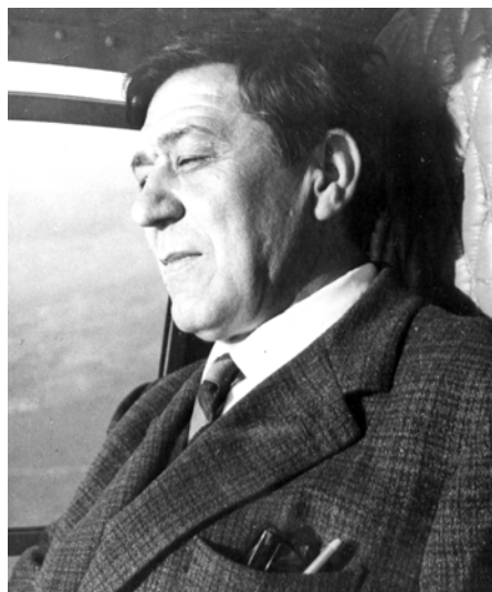
1966, în elicopter, Italia