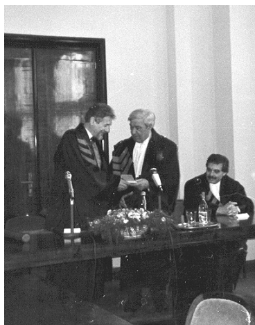
1994, București, doctor honoris causa al Universității din București; rector, prof. univ. dr. Emil Constantinescu