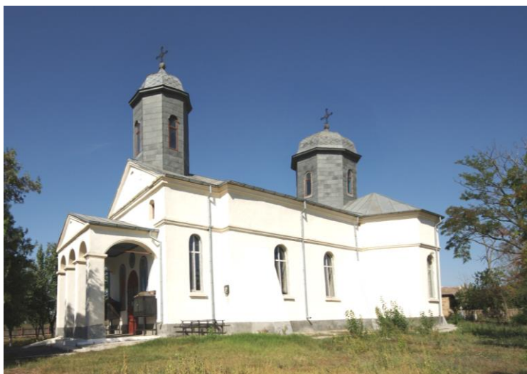
Fig. 15. Biserica din Făgărașul nou, jud. Tulcea (construită în perioada 1890-1897)