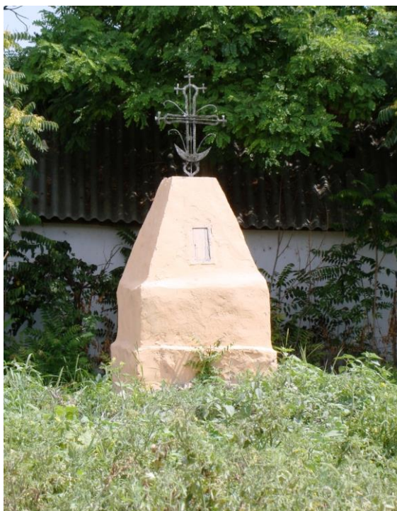
Fig. 5. Altarul vechii biserici din Parcheș, jud. Tulcea