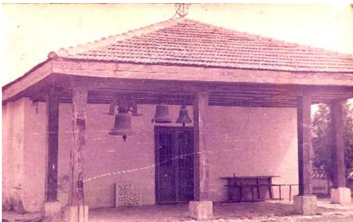
Fig. 19. Fotografie din perioada 1985-1991 cu vechea biserică din Baia, jud. Tulcea (astăzi inexistentă)