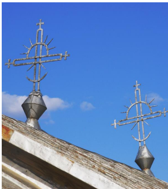
Fig. 12. Cruci situate pe biserica din Plopu, jud. Tulcea (construită în anul 1903)