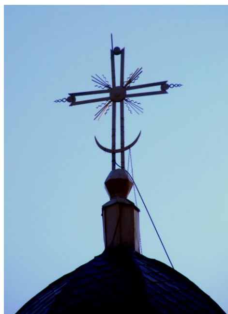
Fig. 21. Cruce situată pe biserica Mavramol din Galați (sf. sec. XVII – început sec. XVIII)