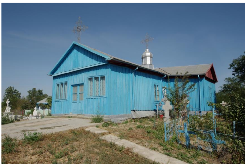
Fig. 14. Vechea biserică din Grindu (Pisica), jud. Tulcea (construită la anul 1875)