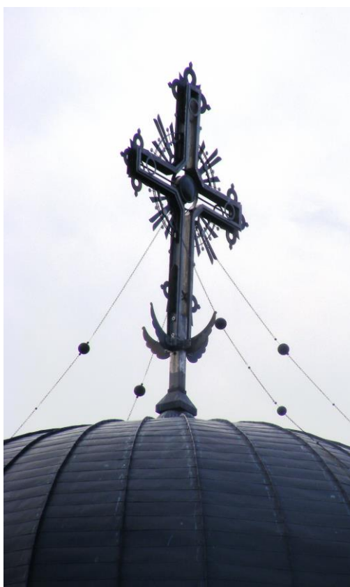
Fig. 22. Biserica Adormirea Maicii Domnului, Târgu Jiu