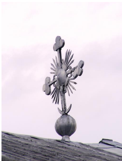
Fig. 11. Una dintre cele 3 cruci situate pe biserica Sf. Gheorghe din Tulcea (construită în perioada 1854-1878)