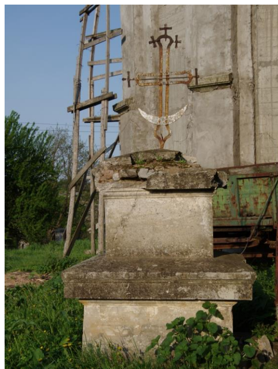
Fig. 6. Altarul vechii biserici din Telița, jud. Tulcea