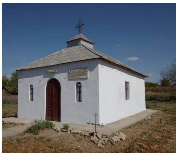
Fig. 17. Altarul vechii biserici din Valea Nucarilor, jud. Tulcea