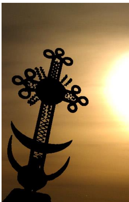
Fig. 20. Cruce neidentificată din Polonia