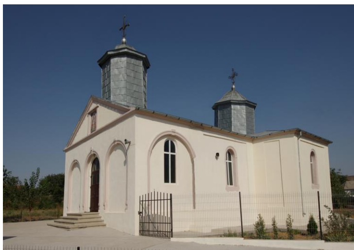
Fig. 16. Biserica din Luminița, jud. Tulcea (construită în anul 1887)