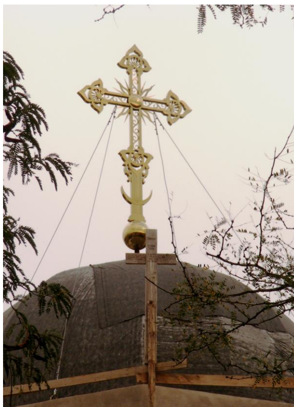
Fig. 13. Cruce montată pe biserica Sf. Trei Ierarhi din Tulcea în anul 2012