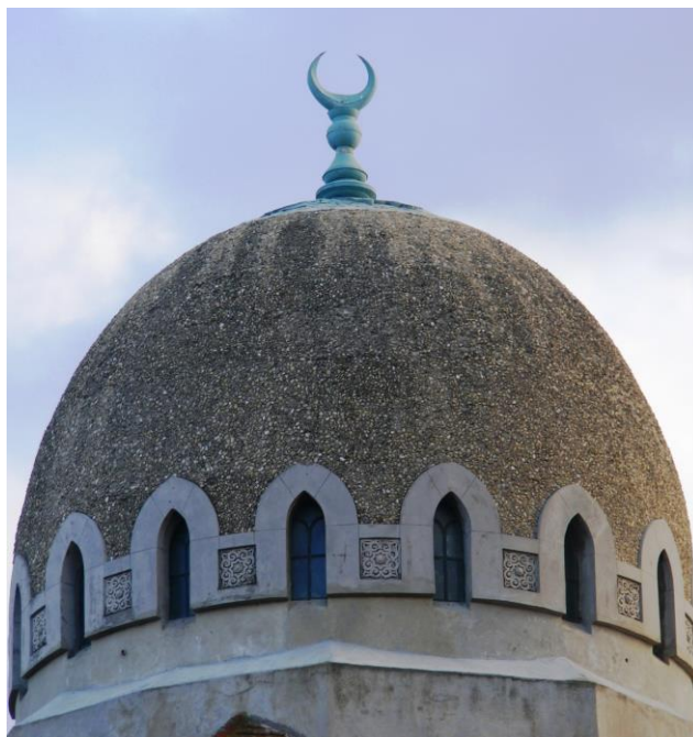
Fig.8. Minaretul geamiei din Ciucurova (1922) Fig. 9. Cupola geamiei Carol din Constanța