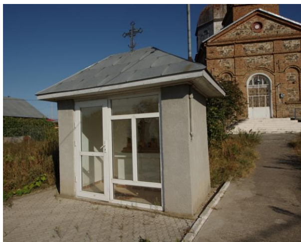
Fig. 18. Altarul vechii biserici din Victoria, jud. Tulcea