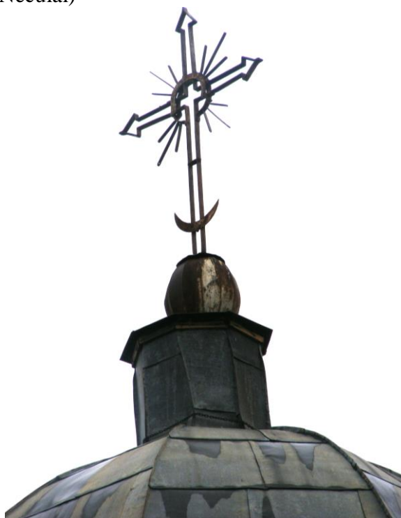
Fig. 10. Cruce situată pe biserica din Ceamurlia de Sus, jud. Tulcea, construită la anul 1839 Fig. 11. Cruce situată pe biserica din Dunavățul de Sus, jud. Tulcea, construită la 1896