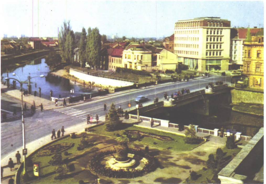
Imagine din centrul municipiului Oradea (1973)