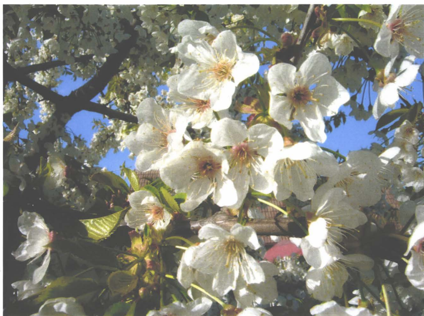
Flori de cireș