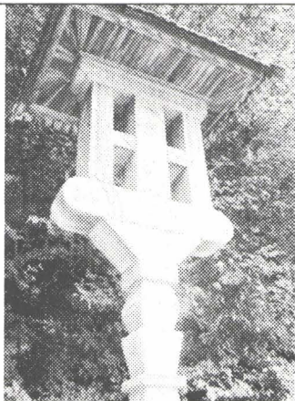
Troița de la Izvorul lui Horea