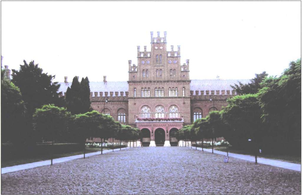
Universitatea din Cernăuți (foto: 2006)