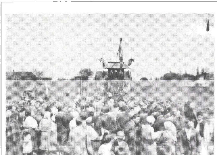
Locuitorii din colonia Lazuri la sfințirea Troiței - 26 mai 1935 - în amintirea eroilor martiri Horea, Cloșca și Crișan

În raportul său, plin de mândrie pentru frumoasa „operă și grandioasa manifestare românească” 58 , preotul sublinia faptul că, la eveniment, au luat parte sătenii coloniei și numeroși credincioși din satele din jur, chiar și de alte confesiuni, fiind amintiți credincioșii greco-