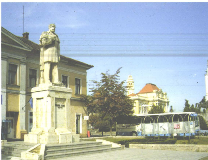
Statuia lui Emanuil Gojdu