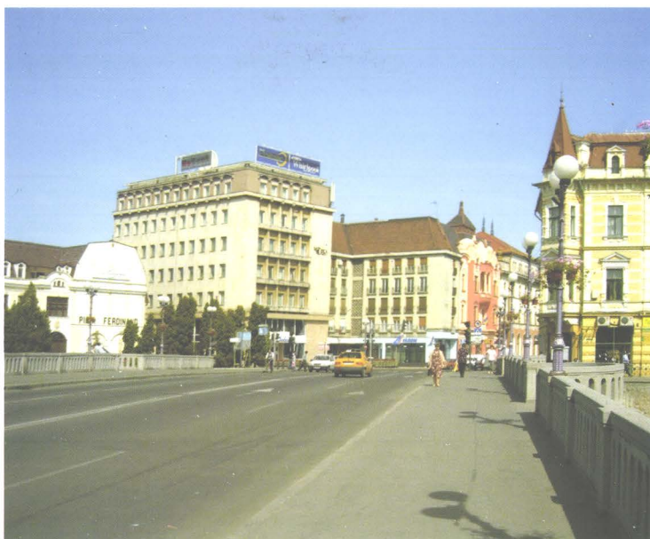
Imagine din Municipiul Oradea