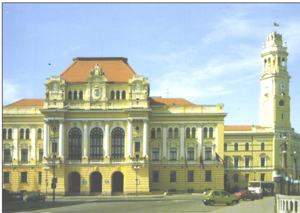
Primăria Municipiului Oradea