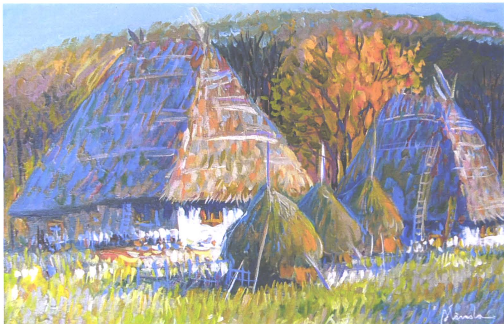
Case vechi țărănești (de Paul Blânda)