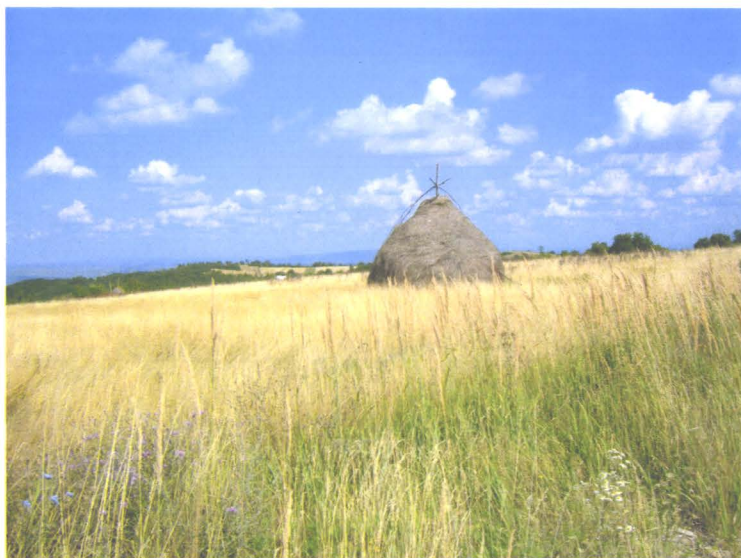
Peisaj de toamnă la Șinteu (județul Bihor)