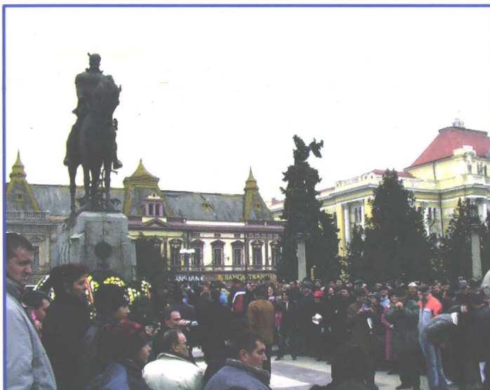
Depunere de flori la Statuia lui Mihai Viteazul din Oradea (1 Decembrie 2006)