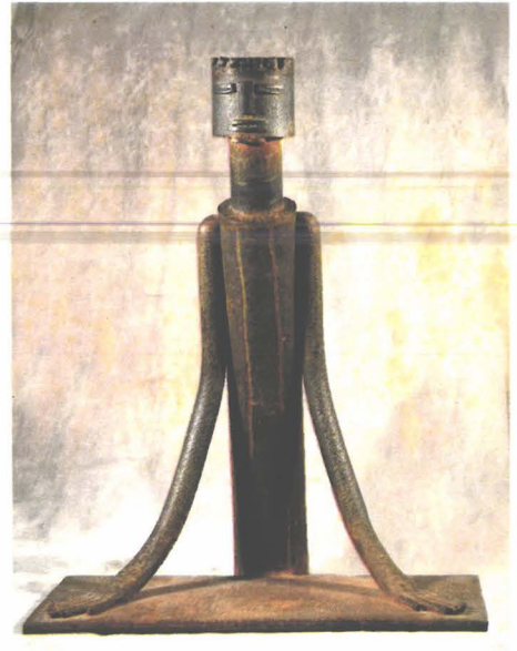
Portretul "Directorului" (de Fekete Jozsef)