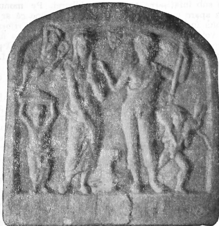
Fig. 1. Tăbliță votivă de la Turda.

de-a lungul coapsei drepte. În picioare poartă o încălțăminte cu carimbul înalt și răsfrînt 21 .