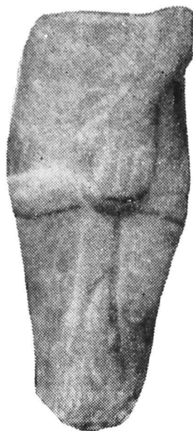
Fig. 2 — Figurină fragmentară.