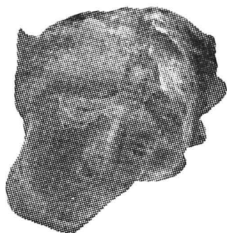
Fig. 3 — Cap de Veneră.