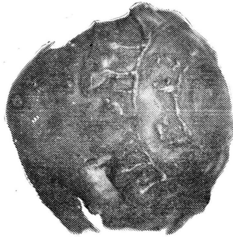
Pl. I. 1 a—d. Cupa de la Dumbrăvița.