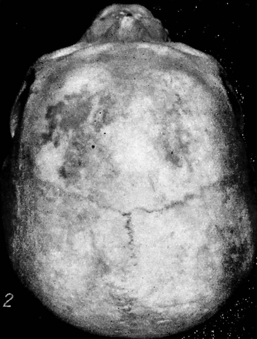
Fig. 1. Craniul scitic de la Cristești (1. Norma facială, 2. Norma verticală)