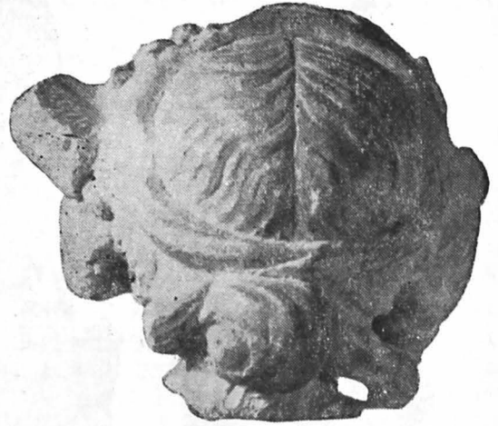
Fig. 8 a. Același, văzut din spate.

ciune feminină 52 . Părul lung, ondulat, cu cărare la mijloc este strâns legat la ceafă într-un fel de coc 53 . Taenia care îi înconjoară capul, împodobit cu vrejuri de viță de vie, este împletită și prinsă pe sub coc în cruciș, capetele ei atârând de o parte și de alta a acestuia (fig. 8a). Urechile sînt acoperite de cîte un ciorchine de strugure cu frunze. Piesa prezintă analogii frapante cu alte fragmente statuare, unul descoperit la Tomis 54 , celălalt la Cluj 55 .