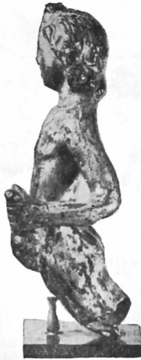
Fig. 9 a. Aceeași, văzută în profil din stânga.