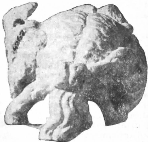
Fig. 7a. Același, văzut din spate.

în stînga arată că piesa făcea parte dintr-un grup statuar, ce pare a fi fost lucrat îngrijit.