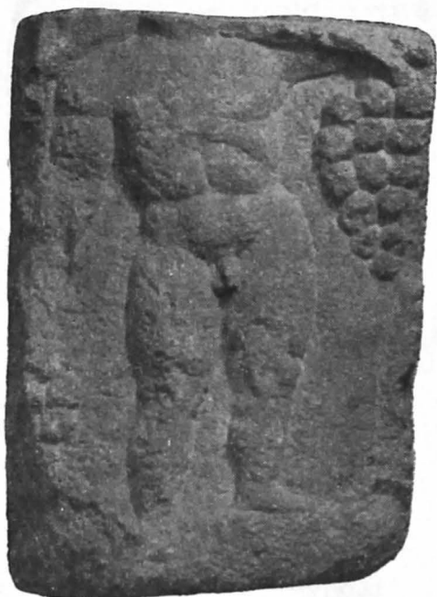
Fig. 3. Bloc cu reprezentarea lui Ampelos.

Deși îngrijit sculptat, proasta conservare a monumentului ne permite să identificăm doar o parte a reprezentărilor, suficientă însă pentru a ne da seama că este vorba de Liber și însoțitorii săi. Zeul, din care se văd numai picioarele, șade pe un trunchi de copac, fiind îmbrăcat probabil cu o nebridă, al cărei rest atîrnă pe coapsa stîngă. În dreapta lui un acolit în picioare, de dimensiuni mai mici, al cărui cap și gambe sînt distruse, poartă o mantie adusă peste cap și care îi înfășoară umărul și partea stîngă a pieptului. Brațul stîng, îndoit, este acoperit de îmbrăcăminte, pe cel drept îl ține în jos. Cu mîna stîngă prinde veșmîntul ce formează un fald și în care se află un măr, iar în dreapta are un obiect greu de definit, se pare un ciorchine de strugure. Jos în stînga lui Liber se află pantera, întinsă pe pîntece. Capul fiarei a fost distrus.