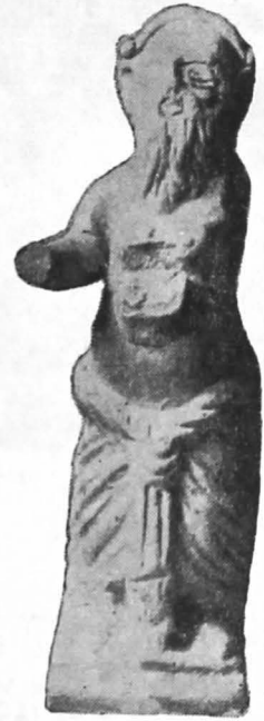
Fig. 10. Silen de teracotă (Turda).

stîng îndoit strînge în mîină, după cum am mai spus, un strugure, brațul drept ridicat în sus lipsește. Șoldurile sînt acoperite de un șortuleț terminat în creștături triunghiulare. Judecînd după partea inferioară curbată a statuetei (fig. 9a), se pare că ea a servit ca mîiner, fie ca ornament de vas sau de mobilier.