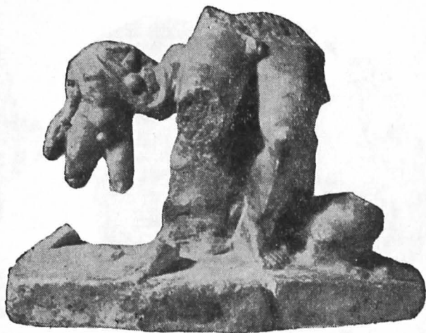
Fig. 4. Grup statuar de la Cluj.

Înfățișează pe zeul Pan din care s-a păstrat doar partea din jos de mijloc, coapsele și pulpele acoperite cu păr des în șuvițe. Un rest de veșmînt