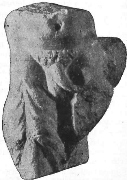
Fig. 6. Fragment statuar de la Răsboieni — Cetate.