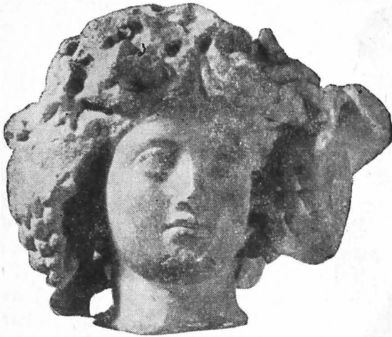
Fig. 8. Capul lui Liber — Dionysos (Turda) văzut din față.