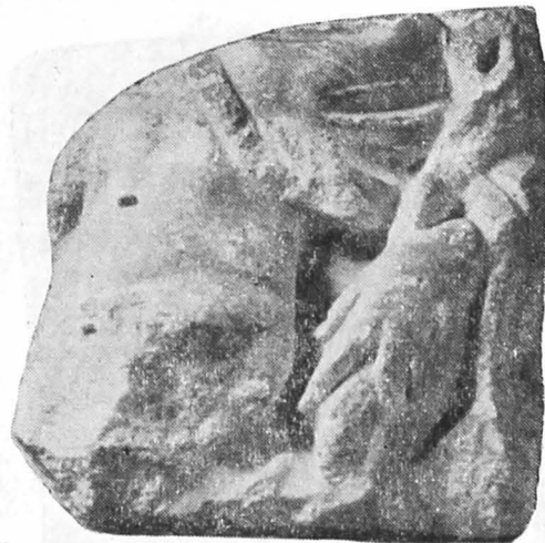
Fig. 2. Relief de la Ilișua.

Latura din față, singura lucrată, prezintă într-un chenar simplu lățit în partea inferioară (4,5 cm) un nud masculin în picioare, al cărui cap (acum lipsește) depășea în forma originală chenarul superior al blocului. Brațul stîng este întins la nivelul umărului și puțin îndoit spre în afară, iar cel