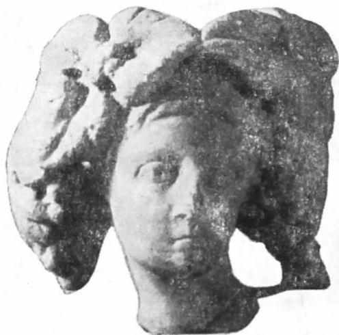
Fig. 7. Cap de statuie (Turda) văzut din față.