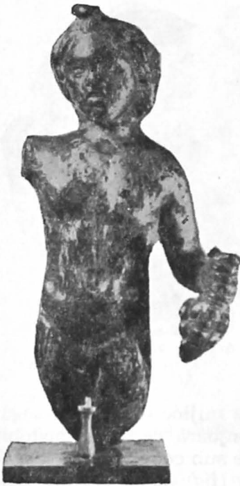
Fig. 9. Statuetă de bronz aurit (Sarmizegetusa), văzută din față.