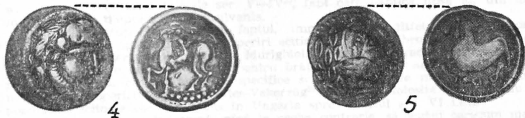
Fig. 2.—4. Moneta din castrul de la Gherla. 5. Moneta de la Sintioana.

3. O monetă dacă de argint de tip Filip II a fost descoperită întâmplător pe teritoriul castrului roman din Gherla. Ea aparține tipului numit de Pink „cu călăreț cu podoabă în formă de B“ (der B-Reiter) și descris de el la p. 78—79, ca pl. XVI/310. D=25 mm. G=12,38 g. Muz. Gherla. Fig. 1/3.