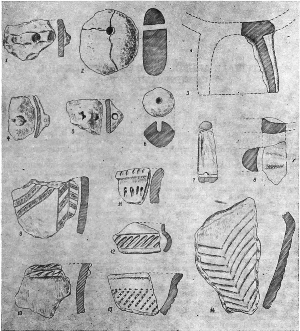
Fig. 1. Crizbav. Fragmente ceramice : 1—3, Criș ; 4—8, Ariușd ; 9—13, Wietenberg ; 14, Hallstatt A—B.

brun-cafeniu) și brun-cafenie (unde fondul este galben). Fragmentul păstrat are dimensiunile: I. = 7,8 cm, lățimea în dreptul șoldurilor 2,9 cm 4 .