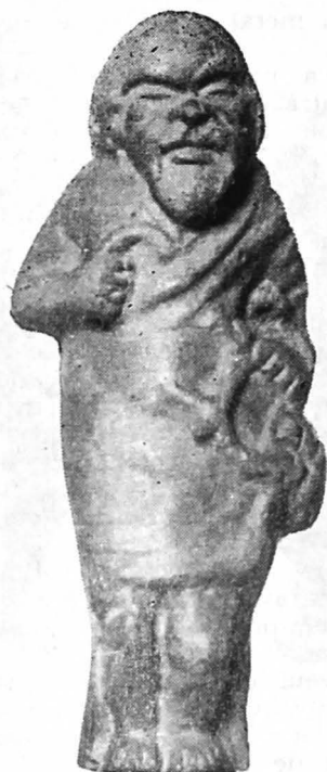
Fig. 3. Teracota de la Pompei.