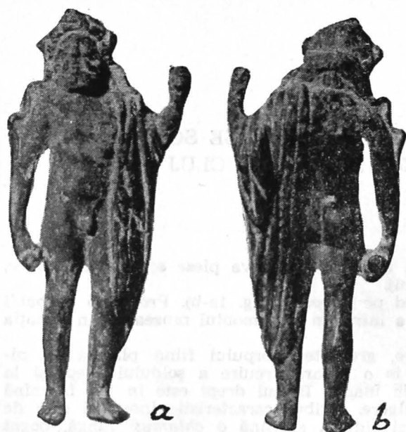
Fig. 1 a — b. Statueta lui Iuppiter din Chiusi.