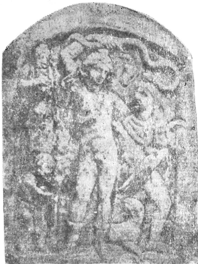
Fig. 7. Grupul dionysiac din Turda.

că prezentarea în acest mod a lui Dionysos este caracteristică lumii daco-tracice 5 . În studiul la care ne referim ne-am străduit să adunăm inscripțiile și monumentele materiale legate de cultul lui Dionysos-Liber. Cele înșirate acolo au fost amplificate în studii noi 6 . Astfel despre prezentarea lui Bacchus în forma grupului de la Colchester, pe lângă monumentele cunoscute pînă atunci (monumentul de la Turda, cel de la Alba-Iulia și de la Surduc, amintit de Domaszewski 7 ), au fost descoperite sau semnalate piese noi, dintre care una provine de la Baurene în Bulgaria 8 , iar altul de la Gradsko (Stobi) 9 în Macedonia (R.S.F. Iugoslavia). Două sînt amintite de Toynbee, în parte, pe baza comunicării lui M. I. Vermaseren, ca adaus la monumentul de la Colchester 10 . Primul dintre acestea a fost găsit la Șiștov în Bulgaria și, în prezent, se află în Muzeul Național din Sofia. Acesta reprezintă o variantă a aceluiași grup: Bacchus ține cu mîna un șarpe, iar pe lângă el stau un satyr, Pan și Silenus 11 .