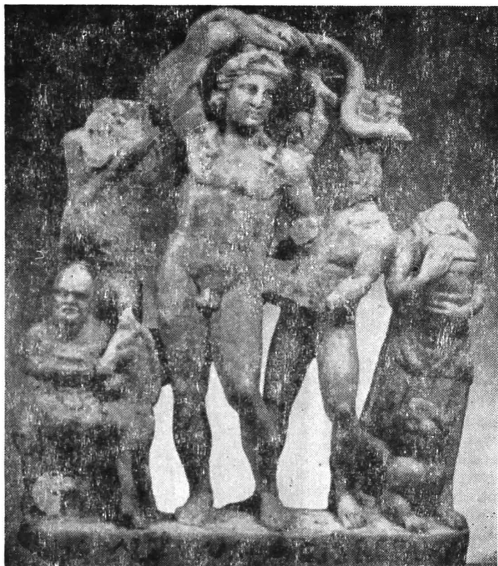
Fig. 6. Grupul dionysiac de la Walbrook.

se văd lângă capul zeului, gravate printr-o reliefare subțire pe fundal. Din stînga celui care privește este un trunchiu de copac pe care se agață Pan cu barba, ținînd un syrinx (fluierul lui Pan). La piciorul copacului este Silenus, jumătate îmbrăcat, chel, în acest caz nu călare pe un măgăruș, ci mergînd cu ajutorul unui băț, spre dreapta. Pantera stă culcată pe partea dreaptă, în spatele piciorului stîng al zeului și privește spre stînga, către stăpînul său. Menada lipsește, dar Satyrul loial este prezent, pășind spre dreapta, purtînd o manta scurtă și ținînd peditum (bîta de păstor încovoiată de aruncat) în mîna stîngă, iar cu mîna dreaptă spatele lui Bacchus, a cărui mîna stîngă este aruncată peste umerii lui. Pe relieful din Bulgaria, Pan se agață în colțul superior al trunchiului de copac, dar sub el o menadă bate timpanum (tamburina), iar un Satyr jucînd cu pantera ia locul lui Silenus. În extrema stîngă apare menada cu cista mystica , pe cînd Bacchus își ridică mîna încolăcită de șarpe deasupra capului și poartă o nebris .... Este probabil că șarpele pe toate aceste scene simbolizează pe mortul fericit.