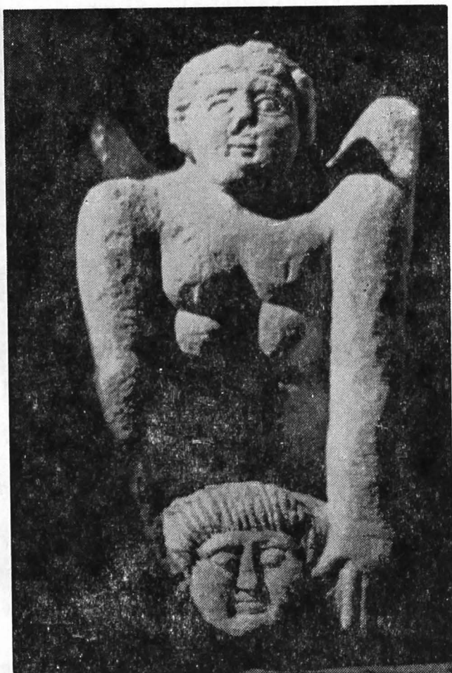
Fig. 5. Un sfincș din Alba Iulia cu capul defunctului.

Asemănarea monumentului cu cel de la Turda o recunoaște și autoarea. Înainte de a da o explicație mai amplă asupra acestui fapt, sînt citate constatările ei: „Această prezentare a lui Bacchus nu este larg răspîndită în lumea romană și paralelele cele mai apropiate cunoscute acestui autor sînt două reliefuri de piatră, ambele prezentînd scene bacchice în cadrul unei nișe scunde și arcuite una de la Turda din România, iar cealaltă de la Hissar din Bulgaria 3 . Și aici Bacchus ocupă centrul cîmpului. Dar pe reliefurile cel dintîi, nuditatea lui este alterată cu încălțăminte și cu o nebris (piele de căprioară), iar greutatea este pe piciorul stîng. Mina dreaptă și-o ridică deasupra capului, fiind încolăcită de un șarpe foarte mare pe care îl prinde cu mîna dreaptă... O ramură de viță de vie și un ciorchine