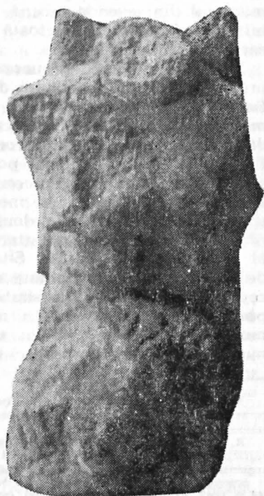
Fig. 4. Un sfinx fără cap de meduză de la Muzeul din Deva.