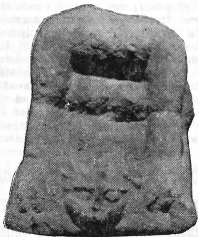
Fig. 3. Un sfinx cu cap de meduză de la Muzeul din Deva.