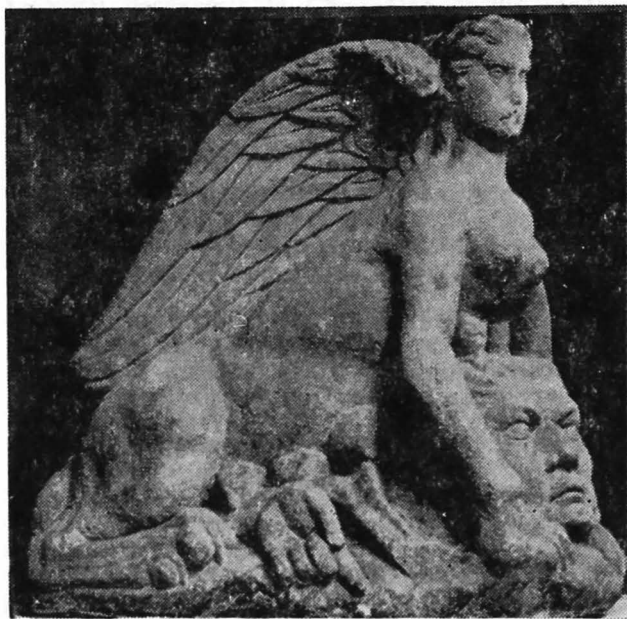
Fig. 1. Sfinxul descoperit la Walbrook.