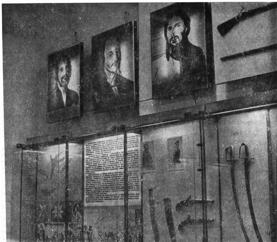
Fig. 5. Muzeul de Istorie Cluj. Horea, Cloșca și Crișan. ( ActaMN , IV, p. 559.)

desfășurării răscloalelor, sau gravura contemporană ce reprezintă pe răsculați atacînd și incendiind tîrgul Trascău (Rimetea) sub privirile lui Horea și Cloșca, mărturisesc amploarea răscloalei, dirzenia și hotărîrea răsculaților.