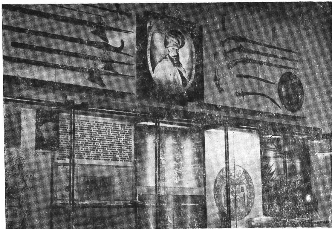
Fig. 4. Muzeul de Istorie Cluj. Exponate privind lupta lui Mihai Viteazul.