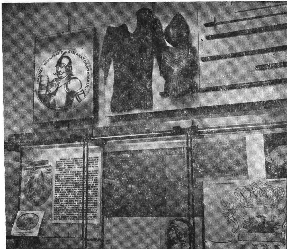
Fig. 2. Muzeul de Istorie Cluj. Colțul lui Iancu de Hunedoara.

și participase apoi între 1433—1434 în Cehia la războiul împotriva husiților — îi aduse aceștia o serie de elemente noi. Astfel, în „campania cea lungă” din 1433, acționează fulgerător, cucerind Nișul apoi Sofia și fiind oprit de venirea iernii și de greutatea de aprovizionare la Zlatița în inima Balcanilor. Elementul surpriză a fost catastrofal pentru turci. Acțiunile fulgerătoare bazate pe surprinderea inamicului vor constitui un factor esențial și vor caracteriza lupta de apărare anti-otomană a țărilor române. Dar nu numai atât. Iancu demonstrează că numai ofensiva bazată pe acțiuni fulgerătoare, prin surprindere, poate aduce victoria. Izbirea prin surprindere, în locul și momentul voit, vizându-se în special flancurile și spatele inamicului cu tăierea liniilor sale de comunicații, va deveni un principiu imuabil al artei militare românești, având în Ștefan și Mihai pe cei mai iluștri reprezentanți. De fapt, aceste acțiuni gândite din timp și adaptate apoi eventualelor condiții de moment, schimbate, constituie manevra — elementul superior al artei militare, datorită căruia oștiri românești ce reprezentau numeric abia 1/4 din numărul invadatorilor au reușit să obțină succese strălucite asupra acestora, oprind veacuri de-a rândul înaintarea oștilor semilunii la Dunărea de Jos. În timp ce românii manevrează și obțin prin aceasta mari succese, occidentul european luptă conform sistemului berbece — izbirea frontală —, iar Varna (1444) este un exemplu nefericit