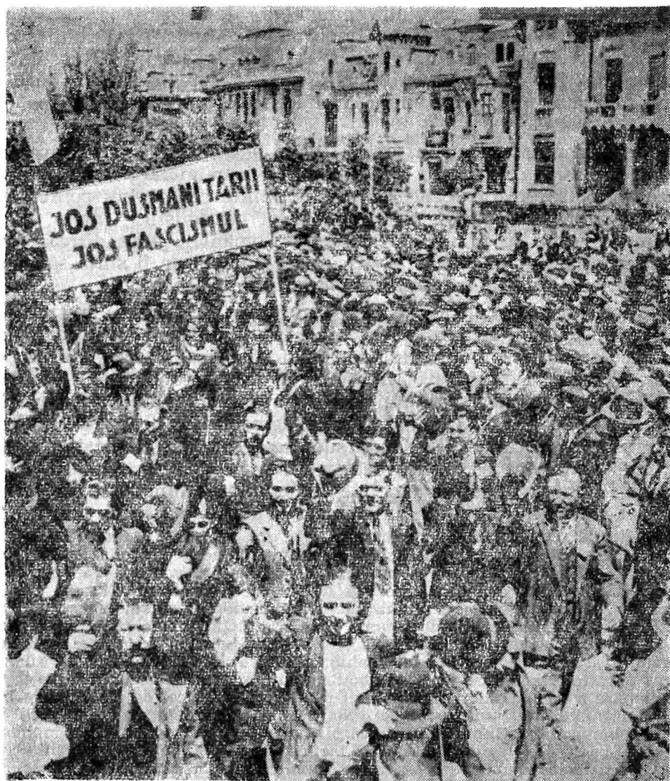
Fig. 1. — Manifestație antifascistă de masă la București în anul 1936.

țiile democrației burgheze, guverne în componența cărora să intre și comuniștii. Noua linie tactică a Cominternului cerea și realizarea unor forme ale unității cu social-democrații, anarho-sindicaliștii, catolicii și alte pături necomuniste din sinul clasei muncitoare și al mișcării sindicale. Aplicarea tacticii frontului popular a făcut să devină absolut necesară unitatea sindicală și politică a clasei muncitoare, creind și condiții favorabile pentru realizarea unei asemenea unități. Internaționala Comunistă a dat o justă apreciere noii situații istorice create prin înaintarea fascismului. Ea a analizat posibilitățile ivite în noua situație și corespunzător acestora a lansat lozincile tacticii frontului popular antifascist. Congresul al VII-lea al Internaționalei Comuniste a propus Comitetului Executiv „să mute centrul de gravitate al activității sale pe tărîmul elaborării orientării politice și tactice fundamentale a