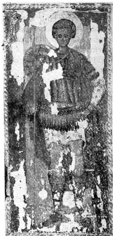
Fig. 7. — Bica — Minăstireni, triptic, 1563, aripa dreaptă, sfântul Dimitrie

veacului al XVI-lea 20 . Pe cap Dumineca poartă o coroană, iar în mina stângă ține o cruce. Legenda Duminecii apare în redacție românească, în literatura religioasă, în veacul al XVI-lea fiind de largă circulație 21 . Ea a fost preluată și transpusă și în pictura icoanelor. Cele două triptice inserează fiecare pe această sfântă.