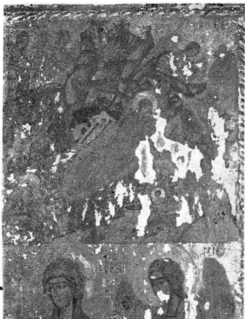
Fig. 9. — Bica-Minăstireni, triptic, 1563, detaliu cu Nașterea lui Isus

un fond portocaliu, iar nimbul de aur trece și peste chenarul verde. Mai bine conservată, icoana sfântului Dimitrie prezintă un tânăr imberb în picioare, îmbrăcat cu platoșă și mantie, pe umărul drept un scut rotund, ținând în mîna dreaptă o lance cu steguleț, iar în stînga o spadă. Pieptarul este decorat cu motive de penaj, iar pe mîneci și piept cu solzi metalici. Spre deosebire de tripticul de la Agîrbiciu în care tratarea celor doi sfinți militari este apropiată tehnicii folosite de pictura murală, cele două personaje de pe interiorul voleurilor tripticului de la Bica sînt tratate mult mai pictural, acordîndu-se o mai mare importanță volumelor, luminii și umbrei. Expresia feței și gestică, deși este aceeași în principiu, apare totuși mai nuanțată la cel de al doilea triptic. Coloritul este mai viu, cu un bogat desen al detaliilor.