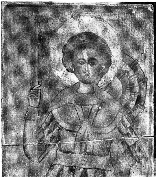
Fig. 4. — Agîrbiciu, triptic 1555, detaliu cu sfîntul Dumitru (clișeu autorului)

Două triptice din zona Huedinului, unul la Agîrbiciu și altul de la Bica—Minăstireni fac parte din aceeași familie cu icoanele budeștene. Amîndouă tripticele sînt lucrate de aceeași mînă, avînd strînse comunități în ceea ce privește reprezentarea temelor iconografice, așezarea lor în pagină după același principiu. Cele două triptice au o mare importanță și prin faptul că ele sînt datate: cel de la Agîrbiciu în anul 1555, iar cel de la Bica—Minăstireni a purtat o inscripție, dispărută între timp prin căderea grundului, publicată de At. Popa, datînd icoana pe la 1563 9 .