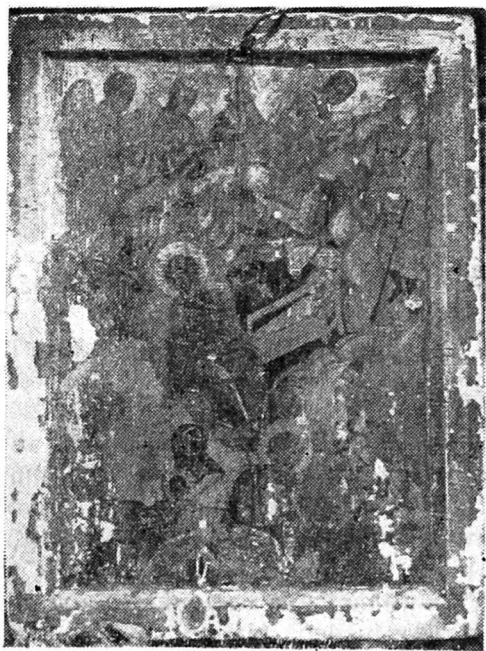
Fig. 1. — Budești-Susani, bis. ort., Nașterea lui Isus

desenul și iconografia, sau proporțiile figurilor. Filiera este evident moldovenească datorată nu numai caracteristicilor stilistice, dar și împrejurărilor istorice, relațiilor strinse pe care le deținea Maramureșul cu Moldova 6 .