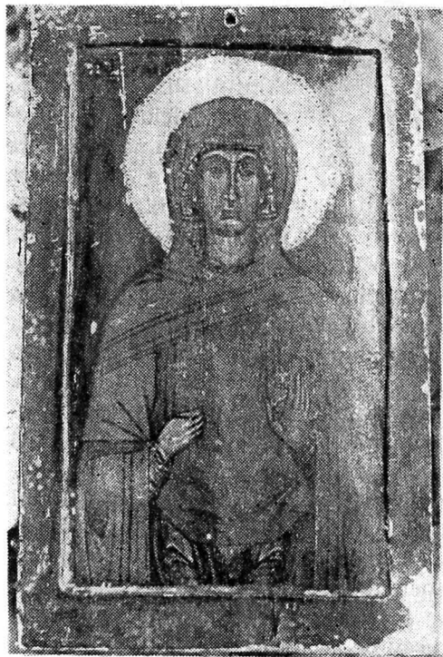
Fig. 3. — Budești-Susani, biserica ort., Mucenița Paraschiva

Maforionul e interpretat liniar, fără redarea volumelor, cu falduri ireale, căutate. Drapajul este de multe ori paralel, fără a avea lumini și umbre. Fără îndoială forma crucii pe care o ține în mîna dreaptă, ca și desenul mîinii stîngi, ridicate în semn de rugăciune 8 sînt aidoma celor din reprezentările aceleiași sfinte în tripticele de la Agîrbiciu și Bica. În jurul capului nimbul de aur accentuează culorile calde ale feței, prin contrastul creat de culorile reci ale maforionului. Nimbul are incizate mici pătrățele punctate pe colțuri. Grafia faldurilor, cu linii groase, nu este străină nici celor două triptice lucrate de același autor pentru bisericile din Agîrbiciu și Bica.