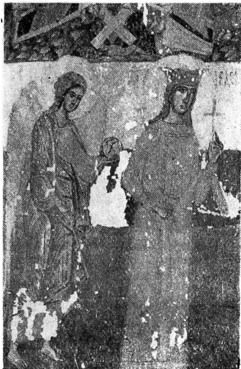
Fig. 8. — Bica — Minăstireni, triptic, 1563, detaliu cu arhanghelul Mihail și sfânta Duminecă

Indiscutabil cele mai multe comunități nu numai de stil și mod de concepție, dar și de felul în care compune meșterul o scenă o are icoana Nașterii lui Isus, ce apare atît de la Budești și Bica, cit și la Agîrbiciu. Această scenă subliniază, alături de celelalte detalii, faptul că întregul grup de icoane este lucrat de același artist. Schema iconografică este aproape aceeași. Imaginea nașterii de la Bica are în colțul din stînga doi îngeri, ce sînt identici cu reprezentarea din icoana prăznicar budeșteană. Forma capului cu pomeți proeminenți, pieptănătura părului sînt aceleași în cele două icoane. Identitatea merge mai departe: felul în care zugravul pensulează culorile, dozarea cromaticii și aceeași tehnică vorbesc de aceeași apartenență. Regii magi apar călări în tripticul de la Bica, ca în icoana de la Agîrbiciu. Maria este