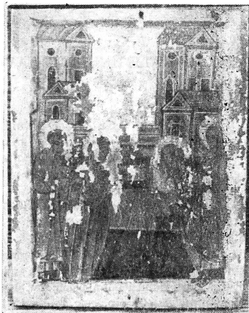
Fig. 2. — Budești-Susani, bis. ort., În-tîmpinarea domnului

Icoana muceniței Paraschiva de la aceeași biserică are dimensiunile de 55×35,5 cm, fiind pictată pe lemn de tei dintr-o singură bucată, dăltuită, avînd în spate o singură traversă. Mucenița este prezentată în bust, puțin mai jos de mijloc, pe un fond de culoare verde închis. La fel ca în cele două icoane moldovenești de la mijlocul secolului al XVI-lea, ce se află în biserica din Budești—Susani, marginea este formată dintr-o bandă puțin supraînălțată față de cîmpul propriu-zis al icoanei. Paraschiva este îmbrăcată într-un maforion roșu-vișiniu. Fața este de tip arhaic 7 , cu un oval bine desenat, cu fruntea mică și ochii mari expresivi și migdalați, sprîncenele arcuite și nasul foarte alungit, iar nările sînt rotunjite. Gura de un roșu aprins este mică, cu buza de jos cărnosă, ce umbrește puțin barba, iar cea de sus dreaptă. Tratarea și compoziția feței este neîndoielnic identică cu cea a Paraschivei din tripticul de la Bica. O notă de arhaism de nuanță bizantină este și încercarea de a da viață celei portretizate printr-o ușoară înroșire a obrazului. Fața este încadrată de maforionul tivit cu aur și căptușit cu verde care are reflexe în alb, realizate printr-o pensulație subțire și paralelă. Sfînta Paraschiva are un gît alungit, ce imprimă portretului delicatețe și gracilitate.