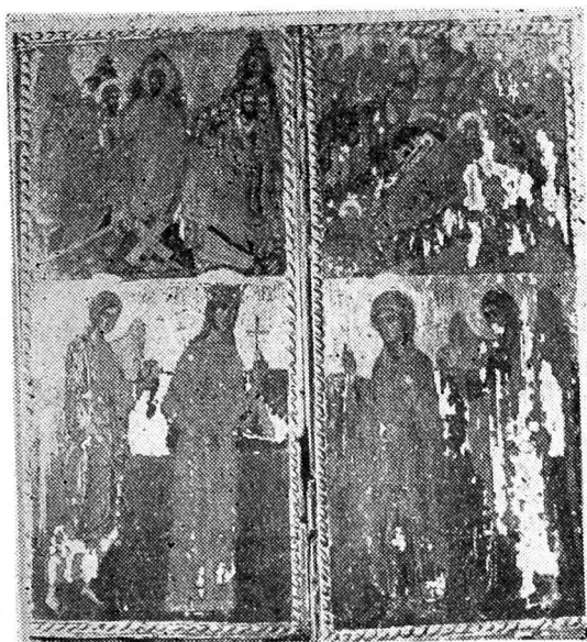
Fig. 6. — Bica—Minăstireni, triptichul închis, 1563

Sub această scenă apar în picioare sfântul Vasile, îmbrăcat în sacos polistavron și omofor, precum și sfânta Paraschiva patroana Moldovei 12 . Paraschiva poartă un maforion roșu, în mîna dreaptă ține o cruce. Fața sfântului Vasile este de același format cu cele ale sfinților Dimitrie și Gheorghe, precum și ale apostolilor din scena Adormirii. Mîinile au degetele alungite. La fel ca și în celelalte cazuri sfinții poartă inscripții nominative, scrise cu alb pe fondul verde. Aripa are același chenar de frînghie răsucită.