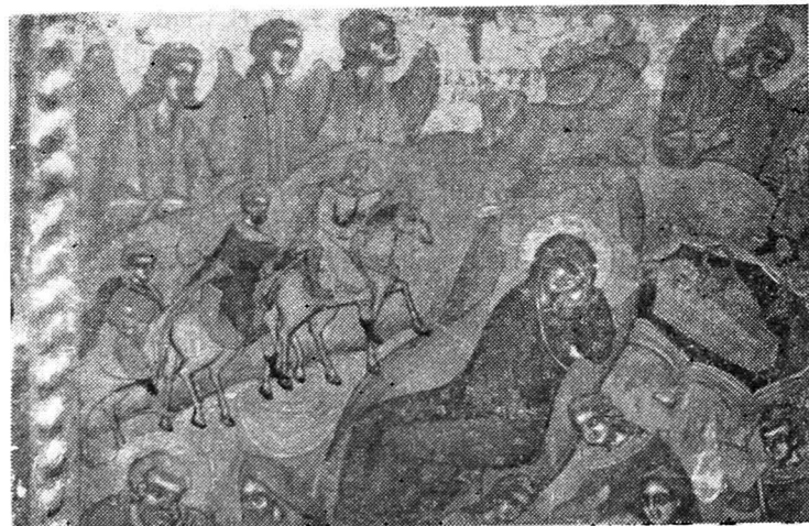
Fig. 5. — Agârbiciu, triptic 1555, detaliu din icoana Nașterii

mis avînd solzi metalici. Pe umăr poartă mantie, iar de gît îi este prins cu o curea un scut rotund ce se vede în partea dreaptă a capului. Fața este rotundă, cu gura mică și ochi migdalați și sprîncene arcuite. În mîna dreaptă ține o lance. În partea inferioară fondul este verde sugerînd solul, iar fondul superior este galben-ocru. Marginea icoanei este marcată de un chenar roșu, asemănător icoanelor de la Budești—Susani. Sfîntul Gheorghe este îmbrăcat asemănător, avînd o poziție inversată față de sfîntul Dimitrie, poziție cerută de simetria tripticului închis. Culoarele veșmintelor sînt inversate pentru a crea o deosebire între cele două personaje. Desenul este același, o linie groasă de contur, iar volumele devin plate, cu puține nuanțări de lumină. Cei doi sfinți militari de pe partea exterioară a canaturilor se caracterizează printr-o tratare monumentală, asemănătoare picturii murale, spre deosebire de interiorul tripticului tratat mai caligrafic, dar evident de aceeași mînă; fapt care îndreptățește ipoteza că meșterul ar fi fost și zugrav de pictură monumentală.