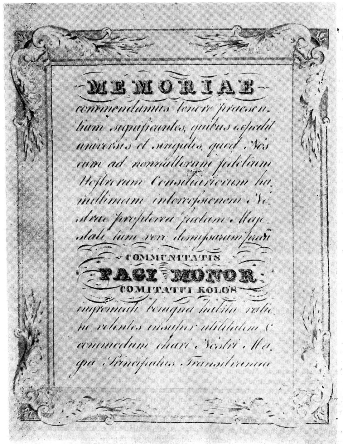
Fig. 2. — Pagina a treia a diplomei în care este recunoscută stăruința satului Monor pentru obținerea târgului