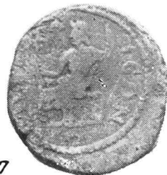
Pl. III. — Monede grecești de bronz emise la: 26—28. Deultum; 29—31. Nicomedia; 32. Thyatira; 33. Ephesus; 34—35, 37. Nicaea; 36. Traianopolis.