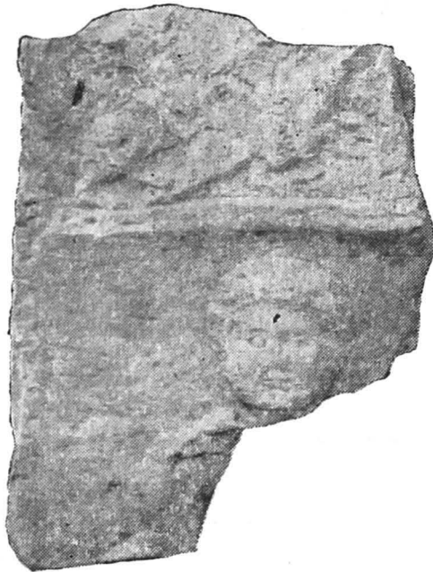
Fig. 3. — Fragment de relief funerar din Botorca (Muzeul din Tîrnăveni).