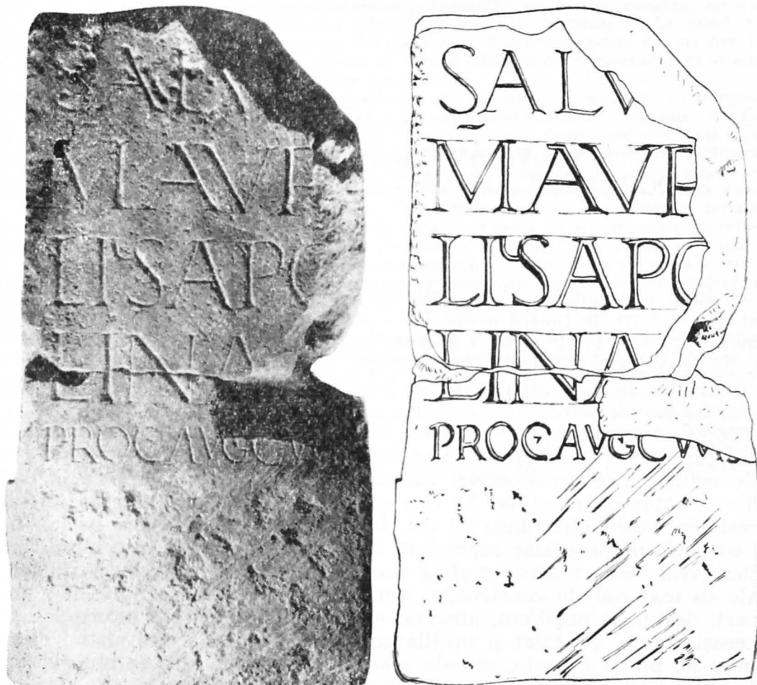
Fig. 1 a – b. – Inscripția din Napoca.

Pe baza (talpa) monumentului, aproximativ la mijloc, se observă majuscula (sau cifra) I, înaltă de 6,5 cm, jucînd probabil rolul semnului de pietrar.