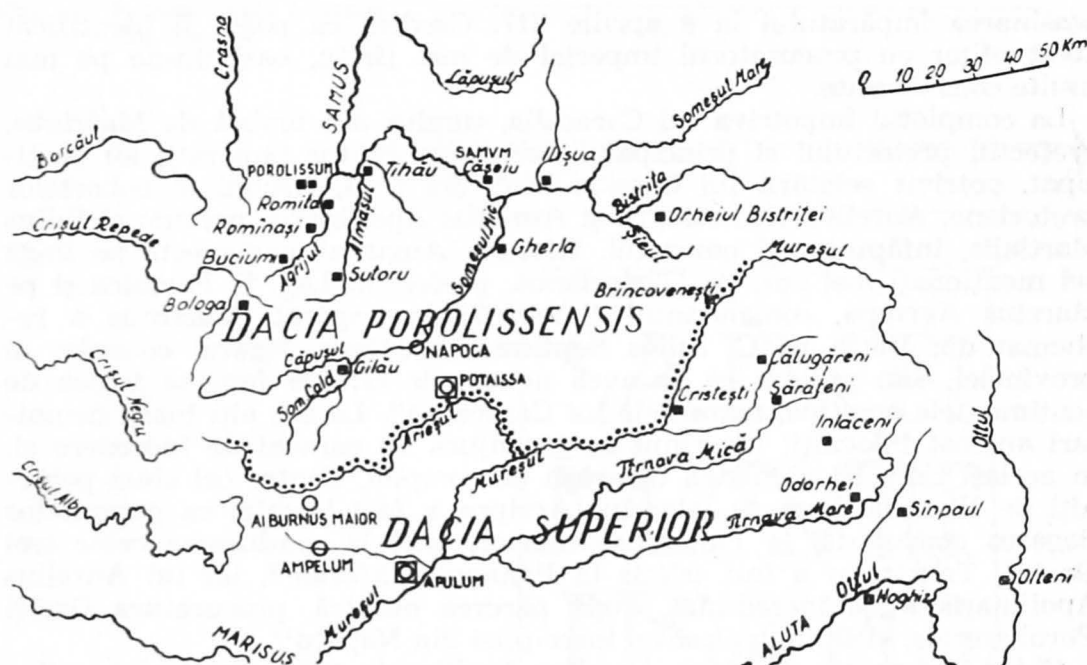
Fig. 3. — Dacia Porolissensis (după C. Daicoviciu și D. Protase).

Aurelius. Face parte din ordinul equestru și înaintează, ca și fratele său, Aurelius Nemesianus, pînă la gradul de tribun pretorian, unde îl găsim la sfîrșitul domniei lui Caracalla. Participă la complotul împotriva acestuia, după care, în timpul lui Macrinus, își începe cariera procuratoriană propriu-zisă, poate tocmai cu acest post de procurator financiar al Daciei Porolissensis (deci în perioada 217—218). Cît timp a îndeplinit această funcție este greu de precizat. Credem că nu a depășit domnia împăratului Macrinus, fiind știut că în timpul lui Elagabal (218—222) partizanii împăratului precedent au fost înlocuiți, iar unii chiar uciși 16 . Nu știm nimic despre restul carierei și vieții sale.