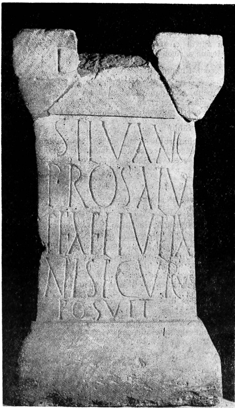
Fig. 13 — Altar de ia Dezmir (Crişeni), dedicat lui Silvanus .