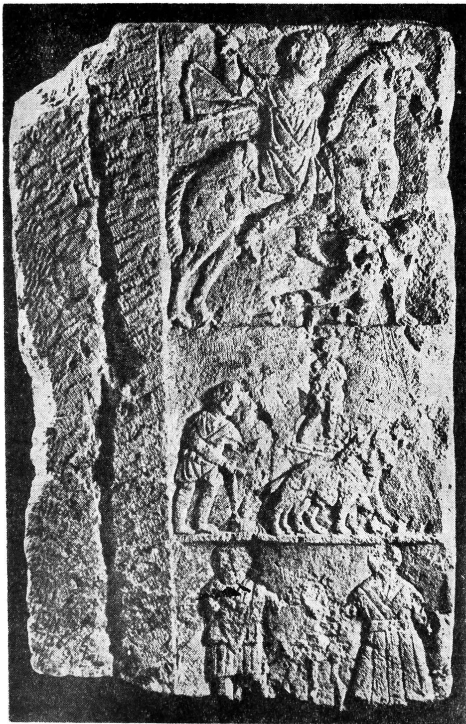
Fig. 14 — Perete de adricula de la Șeica Mică.