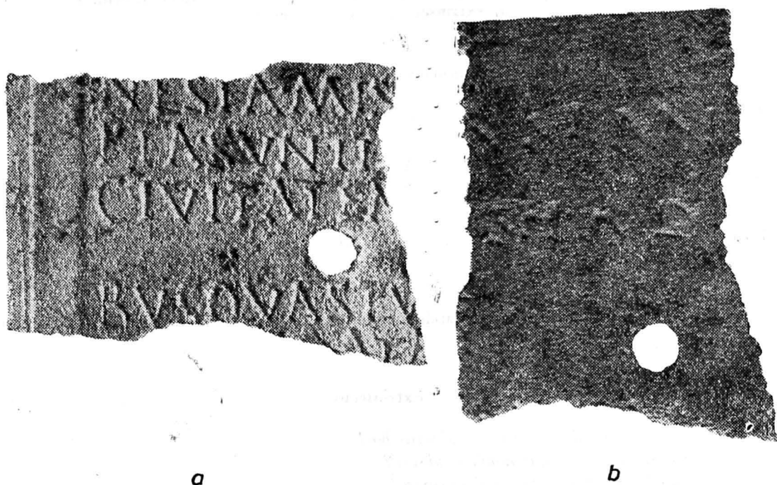
Fig. 1 — Fragment de diplomă militară descoperit la Micia, tabella I, a) extrinsecus, b) intus (ilustrații mărite).

Săpăturile arheologice efectuate în anul 1977 în marele castru auxiliar de la Micia (com. Veșel, jud. Hunedoara) au dus la descoperirea unui bogat material, printre care și un fragment de diplomă militară 1 (fig. 1—2).