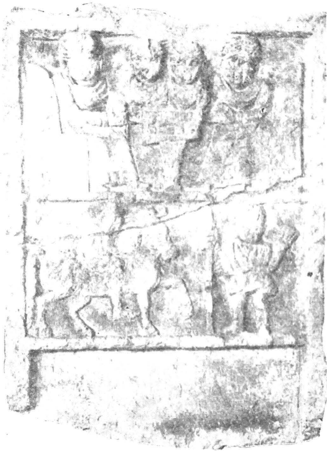
Fig. 5 — Stelă anepigrafă.

5. Stelă funerară 15 ; 122×87×25 cm; calcar; spartă la părțile superioare și inferioare; stare de conservare bună, restaurată; loc de descoperire neprecizat; MuzIstTrans, inv. I. 6909; fig. 5.