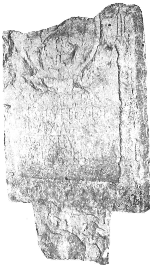
Fig. 3 — Stelă cu inscripție.

Piesa aparține unei stele cu nișa rectangulară. Partea superioară a monumentului lipsind, este greu de precizat dacă cîmpul reliefului nu fusese cumva divizat în două registre. Gr. Florescu o publică fără colțul din stînga sus, lipit ulterior. În cîmpul reliefului este redată scena banchetului funebru. Pe