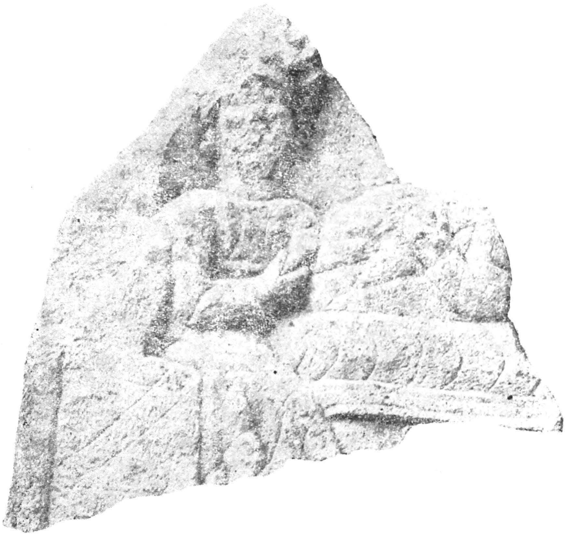
Fig. 6 — Fragment de stelă.

7. Perete posterior de ediculă 17 ; 145×65×15 cm; calcar; spartă în două bucăți reunite, stare de conservare bună; loc de descoperire neprecizat; încadrat în peretele nordic al bisericii catolice din Gilău; fig. 7.