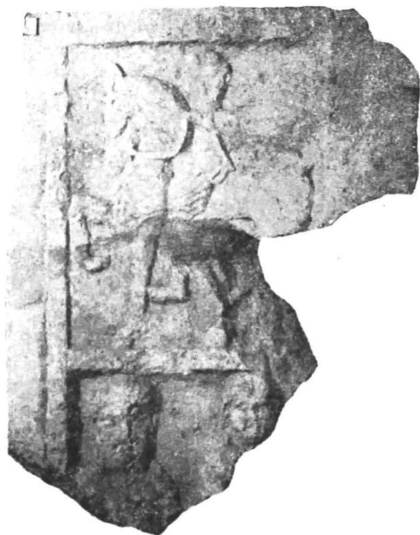
Fig. 8 — Perete de ediculă, fragmentar.

părțile mai adâncite ale reliefului. Execuția piesei este foarte îngrijită. Din păcate nu deținem criterii ferme pentru o datare mai precisă a monumentului. Analogiile de la Potaissa 26 ar putea indica jumătatea secolului al II-lea ca termen după care ori ce datare este posibilă, pe durata epocii romane în Dacia.