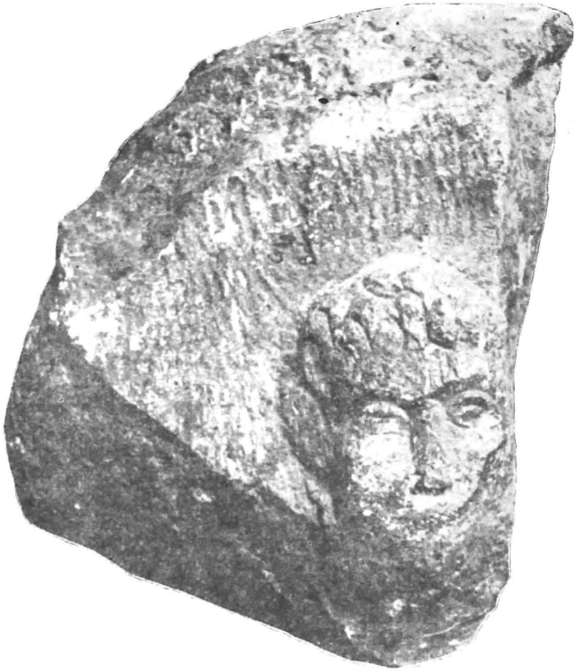
Fig. 11 — Fragment de monument funerar (ediculă?).