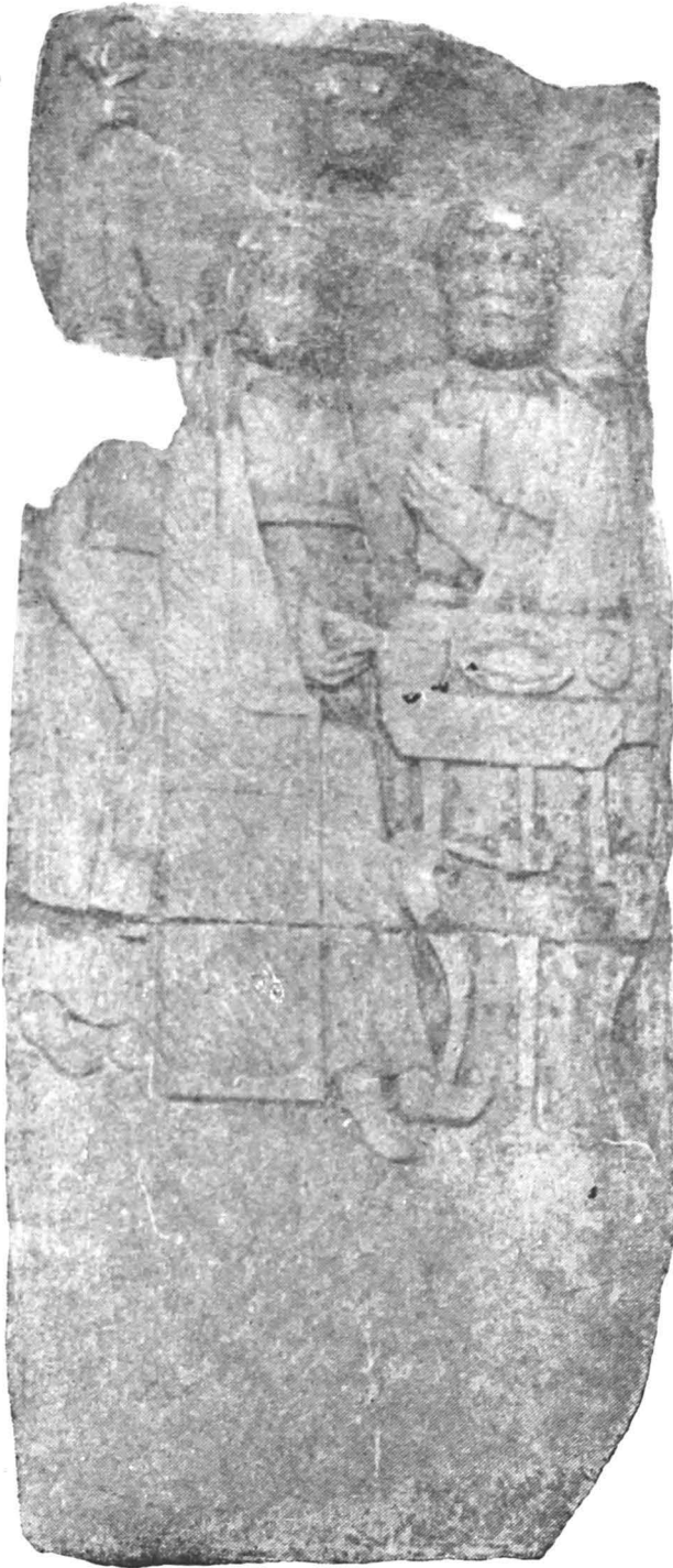
Fig. 7 — Perete de ediculă.