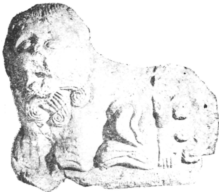
Fig. 14 — Leu funerar asociat cu sfinx.

care se mai poate vedea doar capul și mâna dreaptă, iar între mâini două rozete 42 . În starea actuală a piesei nu se mai poate distinge capul niciunui personaj. „Bărbatul“ în cauză nu se găsește culcat pe spatele leului, ci este, de fapt, un simbol adosat acestuia. În dreapta, jos, se distinge o rozetă, dar cele două protuberanțe de deasupra ei sînt de fapt mamelele sfinxului cu care era asociat leul. Personajul respectiv este deci un sfinx, cu cîteva bune analogii în Dacia 43 . Acest animal fantastic nu are, în cazul de față, între labe obișnuita mască, ci o rozetă. M. Renard consideră ca important aportul trupelor auxiliare în vehicularea acestui motiv de origine vestică 44 . În cazul de față deci, originea panonică a alei Siliana ar putea fi un indiciu pentru apariția tocmai la Gilău a acestui tip de monument de origine vestică. Se remarcă și în cazul acestei piese urme de vopsire cu roșu. Datarea lui este mai greu de precizat.