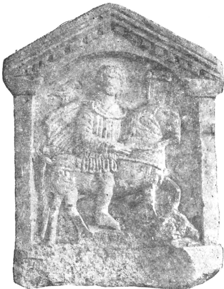
Fig. 15 — Relief votiv în formă de ediculă.

Monumentul, ca formă, imită o ediculă privită din față, cu coloanele terminate într-un capitel simplu pe care se așează un fronton triunghiular la partea superioară și boltit în interior. Frontonul are cornișa decorată cu denticule și cu o bordură dublă.