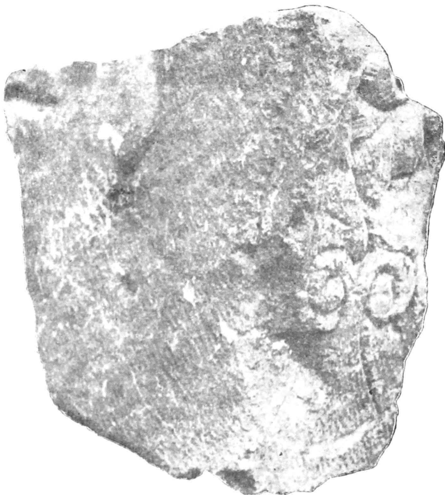
Fig. 9 — Fragment de perete de ediculă.

S-a păstrat jumătatea inferioară a peretelui. Pe cant se păstrează o coloană semiîngropată, cu fușul neted și cu baza schematic redată. Pe fața interioară, puternic corodată, pare a se distinge piciorul unui personaj, similar piesei nr. 9.