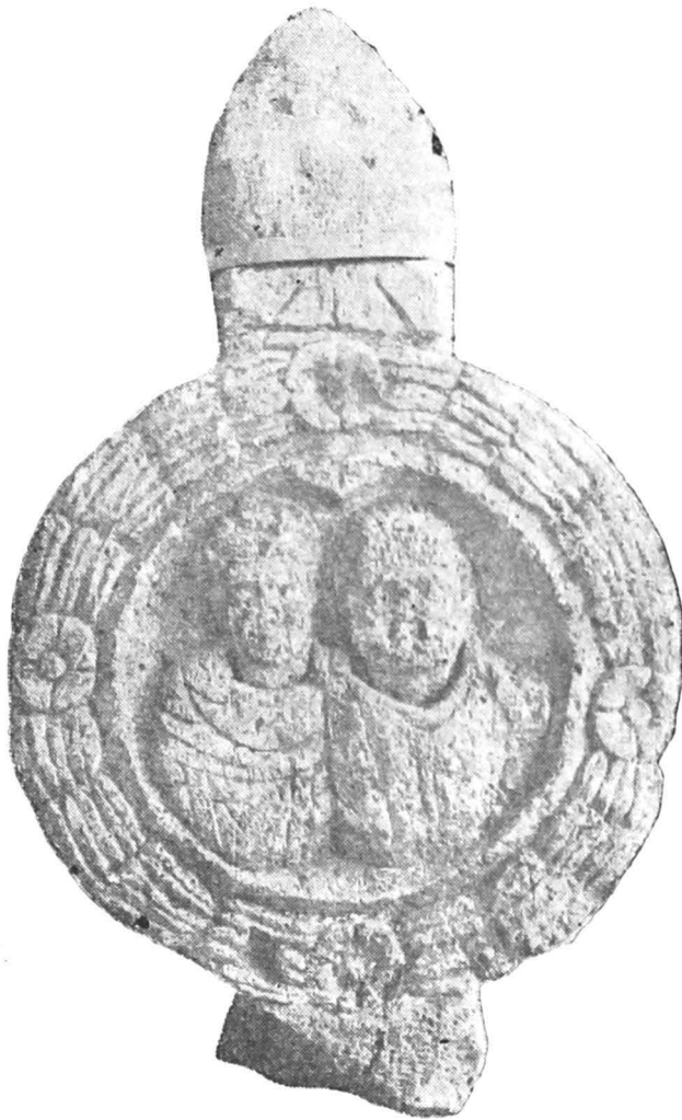
Fig. 1 — Medalion lucrat aparte.

umărul drept cu o fibulă rotundă. Părul său este foarte schematic redat printr-un șir de striuri paralele. În stînga, femeia poartă o tunica și probabil o palla deasupra. Cutele acesteia sînt foarte îngrijit redată, dar totodată extrem de stilizate. Ea are o coafură simplă, cu cărare la mijloc și părul strîns la spate. Nișa este foarte aplatizată, lipsind nervurile cochiliei. Medalionul este decorat pe margine cu o corona de frunze de lauri, lipsită de obișnuita taenia , dar ornată cu patru rozete. Acest ultim element este executat cu deosebită grijă; într-un relief destul de pronunțat. La partea superioară a piesei se găsește un con de pin, fără solzi, înalt de 36 cm, iar la partea inferioară, sculptat de asemenea din același bloc, se află ciotul piciorului de implantare. Piesa a fost în întregime vopsită cu un miniu roșu-portocaliu.