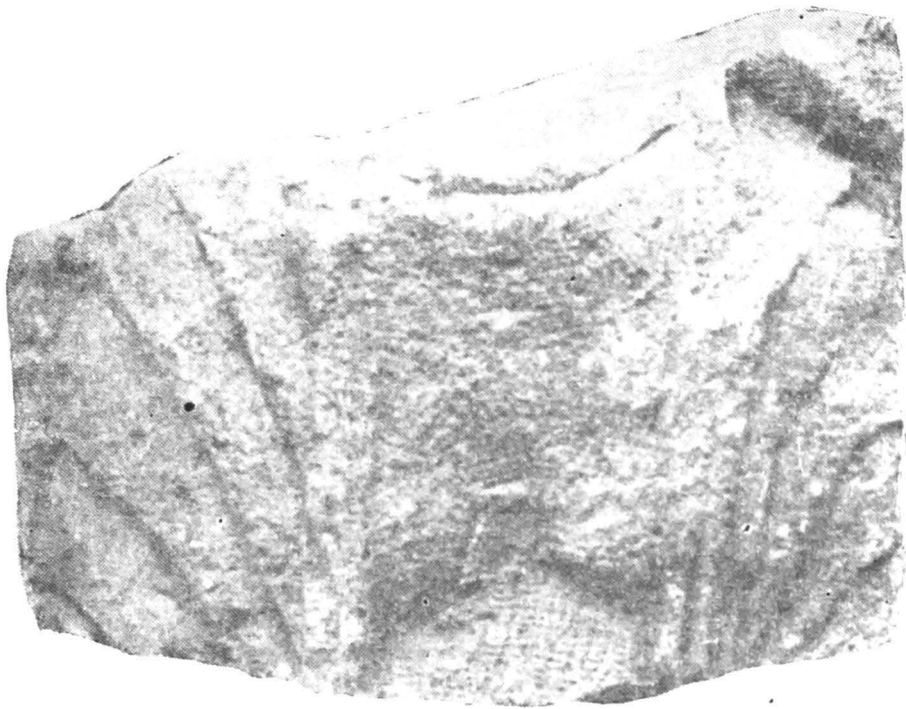
Fig. 13 — Fragment de ediculă (?).

13. Fragment de ediculă (?); 26 \times 18 \times 13 cm; calcar; stare de conservare precară; provine din dărâmurile unei barăci de piatră din castru („clădirea A“, 1976); fig. 13.