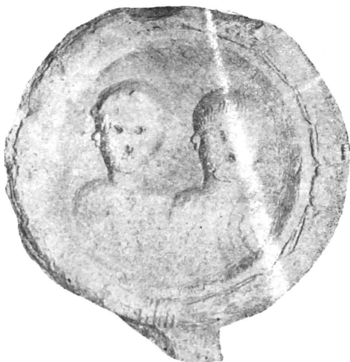
Fig. 2 — Medalion lucrat aparte.

nord-italică și databile în prima jumătate a secolului al II-lea 8 . Piesa de la Gilău este mai îndepărtată însă de modelul original. Execuția, deși schematică, este foarte îngrijită și ne face să punem stilizarea accentuată a tipului de bază nu pe lipsa de exactitate și atenție a artizanului, ci, mai degrabă, pe seama realizării piesei la o dată ulterioară celor similare ei, acest fapt învederînd un stagiū în provincie a modelului cu nișă cochiliformă. Astfel, înclinăm să datăm piesa în a doua jumătate a secolului al II-lea, cînd deja medalionul pare a fi ieșit din modă. (La Potaissa, de exemplu, unde materialul se datează mai ales începînd abia cu a doua jumătate a secolului II, nu există deocamdată nici un fel de medalion lucrat aparte, deși predilecția medalului militar pentru un atare gen de monumente este recunoscută).