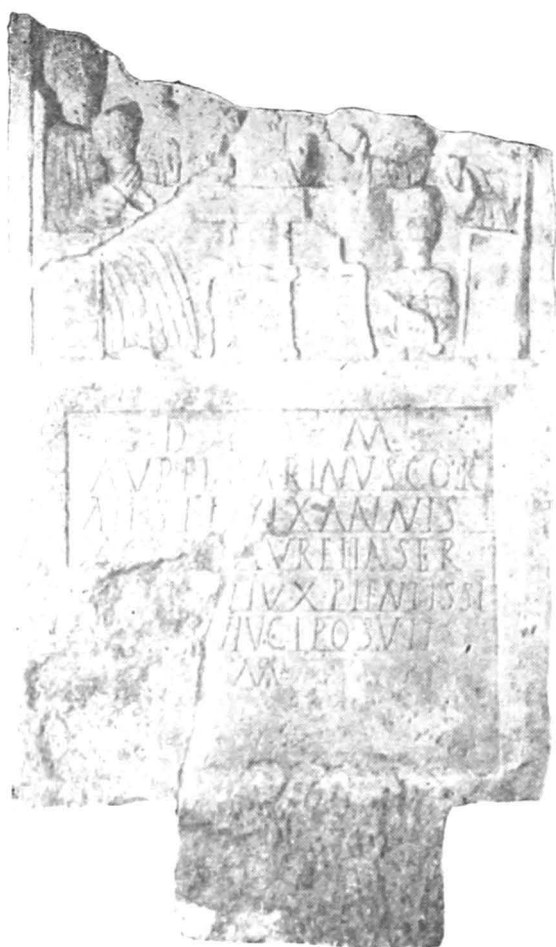
Fig. 4 — Stela lui Aur. Carinus.

precum și unul din picioarele acesteia rămas intact la baza mensei tripes . În spațiul inițial proiectat pentru această reprezentare se pare că artistul s-a decis (poate la intervenția cumpărătorului) să introducă un camillus . Dimensiunile sale sînt normale, dar neîncăpînd în cadru el este redat doar în bust, ținînd cu mîna stîngă un ulcior. L. Bianchi, considerînd că personajul ar fi în întregime redat, apreciază drept „caricaturale” dimensiunile sale 14 . În realitate, liniile trasate pe relief probează unele ezitări ale lapidului. Dealtfel, acesta a omis să mai redea picioarele de la kliné . Relieful, foarte plat, era mai adîncit în zona capetelor personajelor, autorul lui acuzînd o oarecare stîngăcie și inexactitate în execuție. Piesa păstrează aproape pe toată suprafața vopseaua roșie, inițială. Stela a aparținut lui Aurelius Carinus, cornicularius în Ala Siliiana . Avînd în vedere unele inexactități în grafia inscripției, ca și gentiliciul defunctului, piesa se poate data în secolul III e.n.