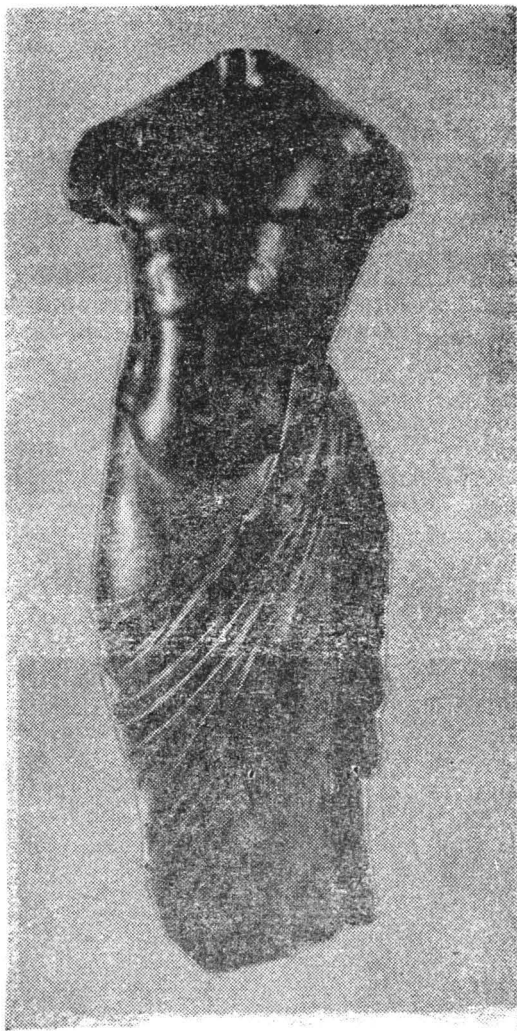
Fig. 3 — Statuetă fragmentară cu personaj neidentificat ( Romula ).

Statueta prezintă un personaj acefal, ale cărui brațe, de la umeri, și partea inferioară a gambelor, sînt rupte. Starea de conservare precară a piesei ne împiedică a identifica cu precizie reprezentarea. Poate palla , cu faldurile bogate, semiovale, lungă pînă la pămînt, care acoperă picioarele personajului și urcă de-a lungul părții stîngi a corpului (în dreptul taliei este distrusă), lăsînd coapsa dreaptă dezgolită, să fie un element — dar nu hotărîtor — pentru a indica personajul ca fiind posibil