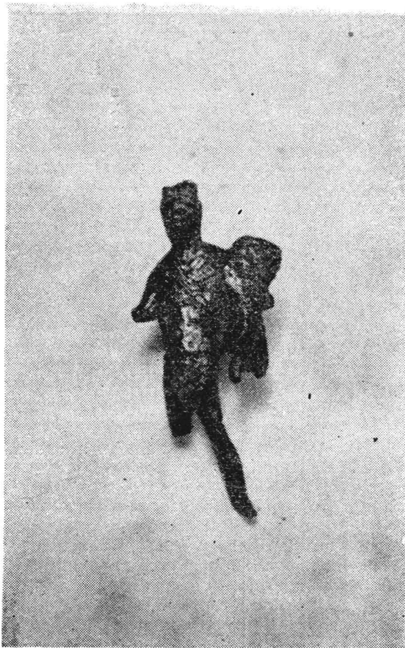
Fig. 4 — Figurină cu Mercurius (Sucidava).

4. Figurină cu Mercurius (fig. 4), din bronz. Dimensiuni: înălțimea 6,4 cm, lățimea maximă 2,6 cm, înălțimea feței 1 cm. Se păstrează destul de fragmentar. Ea provine de la Sucidava (Celei—Corabia, jud. Olt) și a fost cumpărată de la Georgescu-Corabia. Nr. de inventar 230.