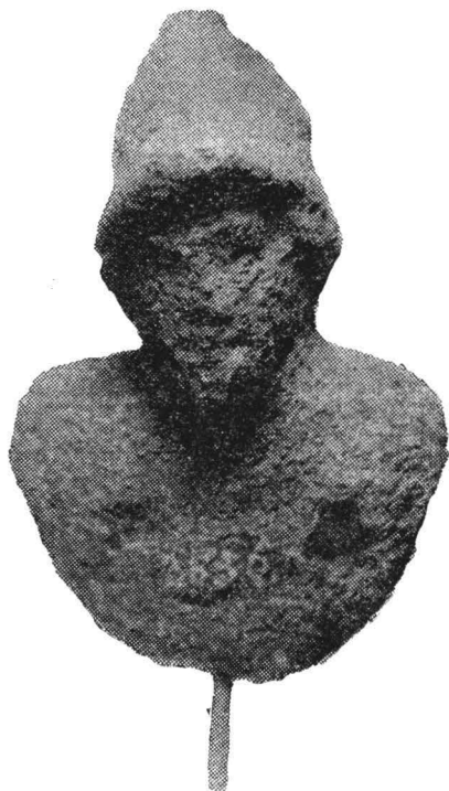
Fig. 5 — Pectoral înfățișînd pe Mars (Transilvania).

Pectoralul înfățișează un tînăr personaj masculin, imberb (detaliile feței șterse), cu coif attic pe creștet. Armura, ca atare, este suficientă pentru stabilirea efebului ca fiind Mars. Două piese asemănătoare, cu mult superioare însă ca execuție, sînt cunoscute în Dacia. Este vorba de două figurine-pectoral din bronz aurit, confecționate la Ulpia Traiana Sarmizegetusa 7 .