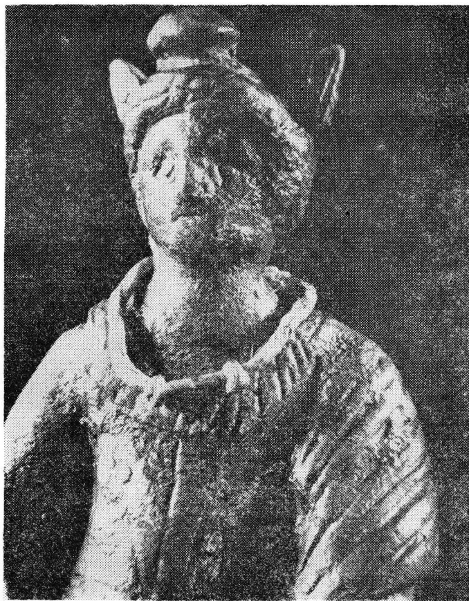
Fig. 1 e. — Mercurius de la Gherla : detaliu.