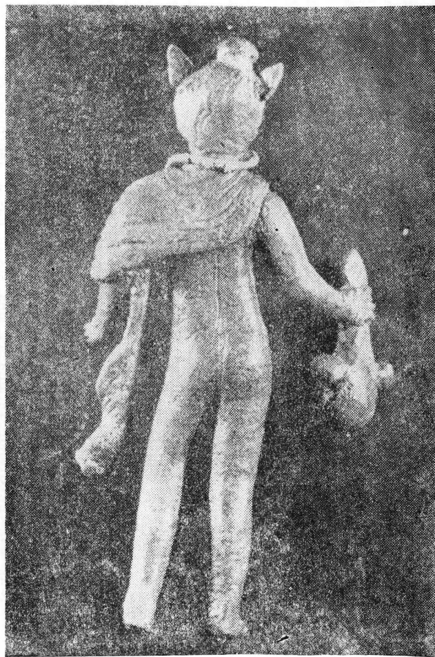
Fig. 1 b. — Mercurius de la Gherla: vedere dorsală.