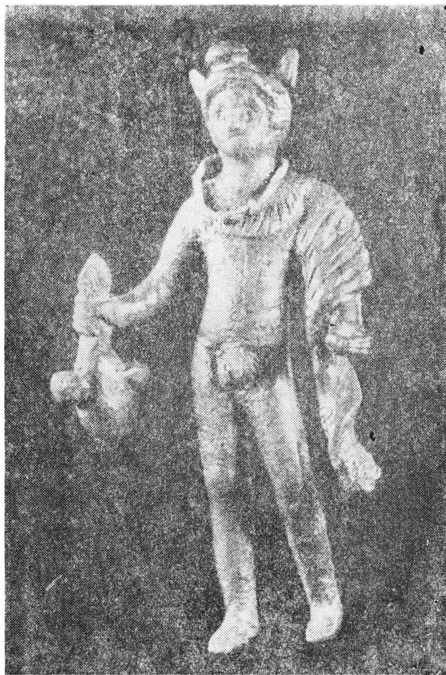
Fig. 1 a. — Mercurius de la Gherla: vedere frontală.