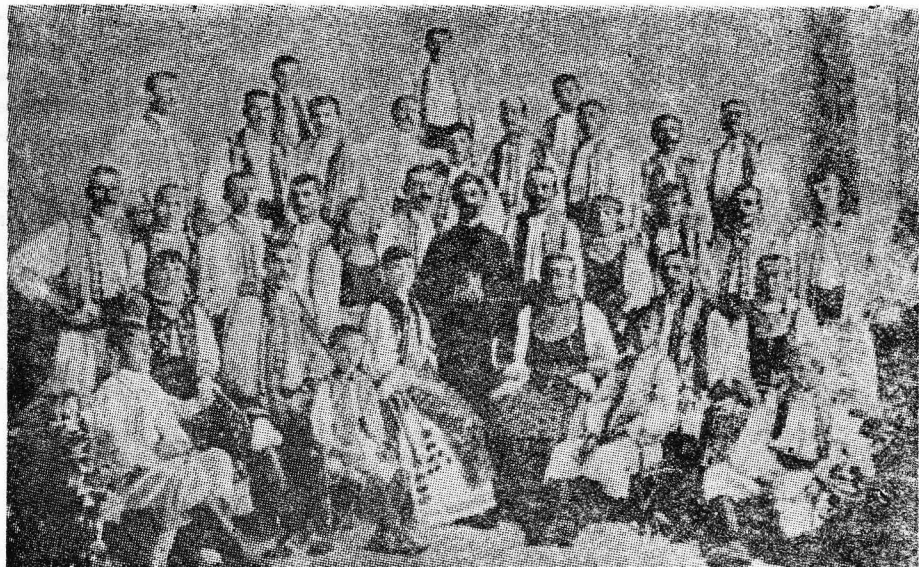
Fig. 3 — Corul plugarilor din Chizătău la Sibiu, în 1892.

1892 la adunarea generală a „Astrei“ de la Sibiu este invitat și corul plugarilor de la Chizătău pentru a concerta la serbările organizate cu acest prilej. După răsunătoare succese repurtate în fața unui public pretentios din Arad, Timișoara, Lugoj, Lipova, Caransebeș și alte centre bănățene, corul din Chizătău se prezenta, în al 35-lea an al existenței sale, în fața reprezentanților românilor din toate ținuturile românești. Ziarul „Foaia de duminică“ care apărea la Timișoara, doi ani mai târziu, consemna acest eveniment în primul său număr, arătând că: „La 1892 o mare cinste a ajuns acest cor. A fost chemat în Ardeal să concerteze la adunarea generală a «Asociațiunii transilvane». Acea a fost poate cea mai sărbătorească zi a corului de la Chizătău, când a cîntat înaintea unui public așa de numeros și ales, cum a fost cel de la adunarea «Asociațiunii» din Sibiu. Români din mai toate părțile erau acolo de față, din Banat, Ardeal, România; atunci dară s-a arătat corul de la Chizătău mai bine înaintea neamului românesc“ 75 .