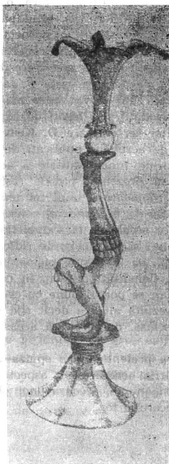
Fig. 3 — Sfeșnic cu acrobat (Potaissa).