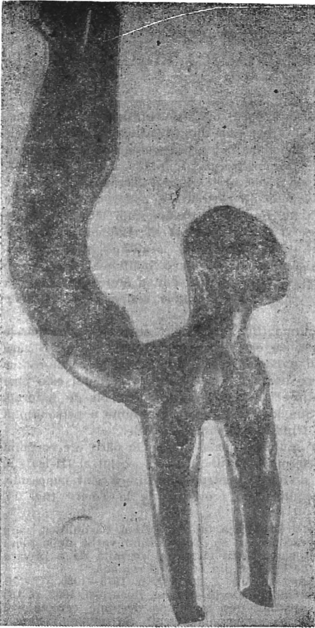
Fig. 1 — Figurină cu cernuus (Muzeul de Istorie al Transilvaniei).