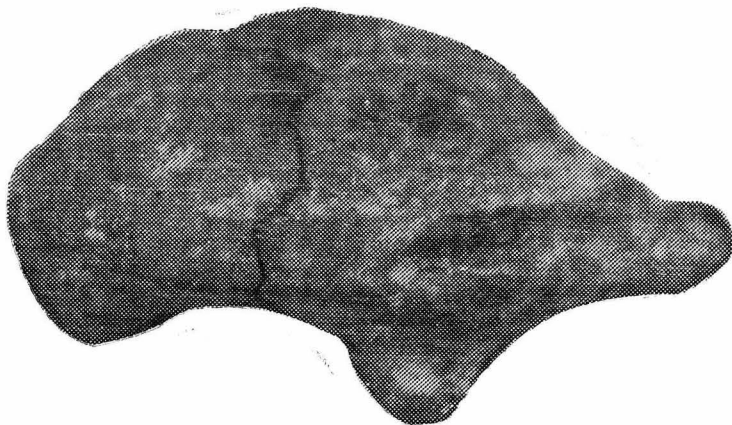
Pl. 3. -- Statuetă (Transilvania), vedere de sus. Pl. 4. -- Statuetă (Transilvania), vedere laterală dreapta.