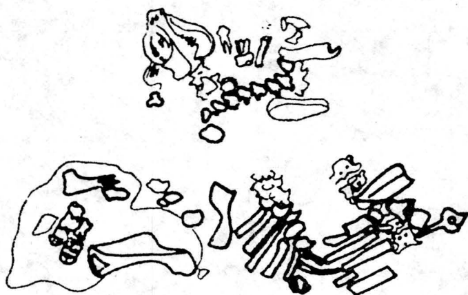
Fig. 1. Resturi de schelet de copil aflate în podeaua locuinței nr. 3