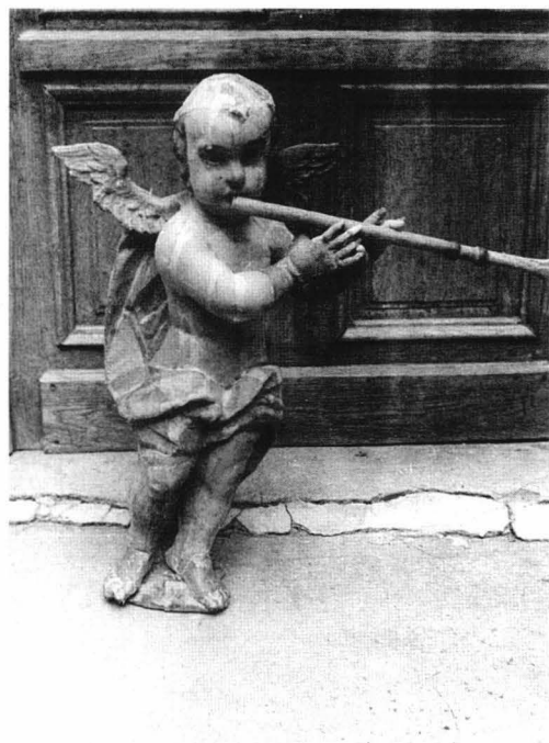
fig.2b "Putti" după restaurare