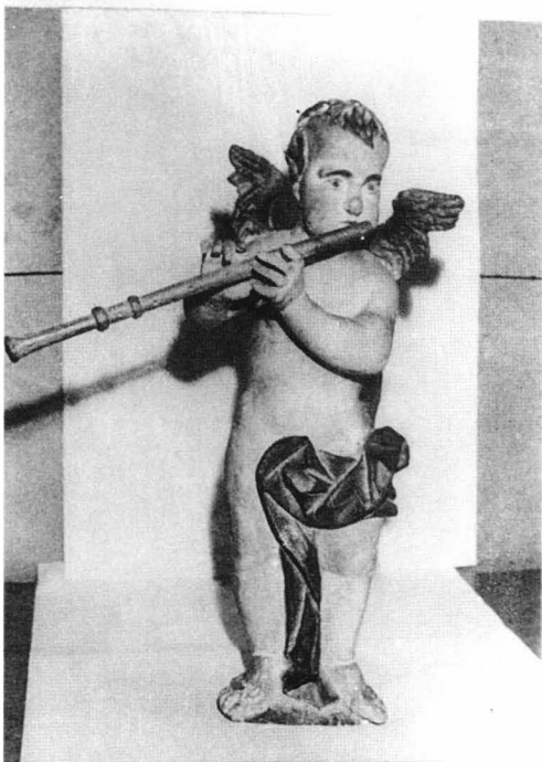
fig.1a "Putti" înainte de restaurare