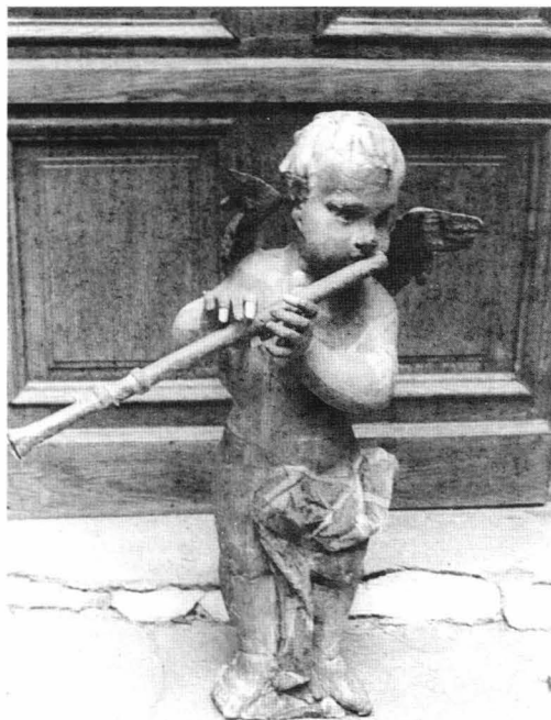
fig.1b "Putti" după restaurare