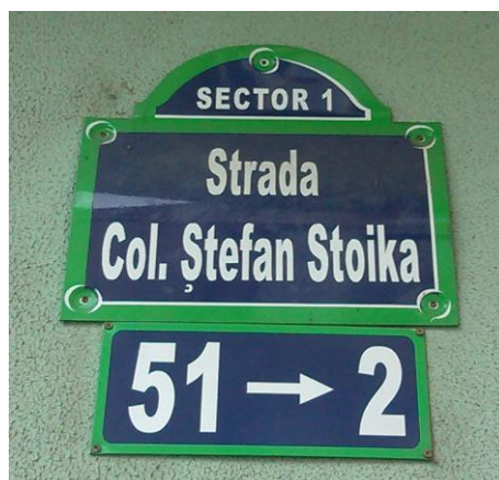
Fig. 7 – Placă cu numele străzii Col. Ștefan Stoika din București