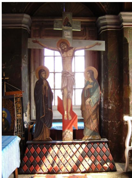
Fig. 13 – Ansamblul Răstignirii lui Isus, cu Fecioara Maria și Sfântul Ioan, din pridvor