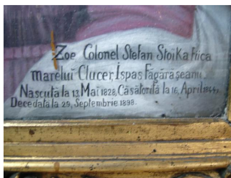
Fig. 21 – Inscripția portretului Zoei colonel Ștefan Stoika