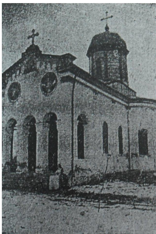
Fig. 9 – Biserica Sfânta Treime din Urziceni (cu pridvorul deschis) – după N. Thomescu-Baciu