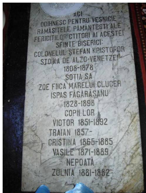
Fig. 15 – Piatra tombală a familiei ctitoricești