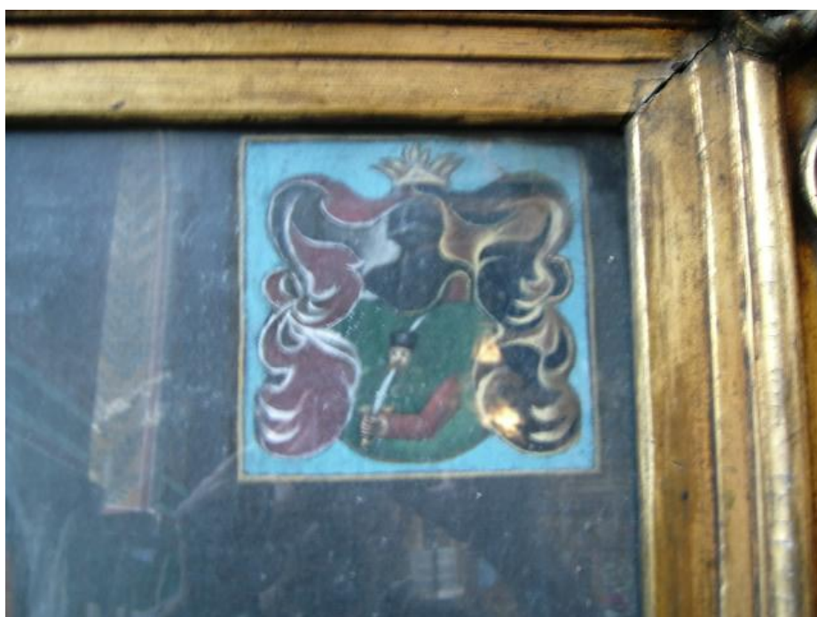
Fig. 22 – Blazonul pictat pe portretul colonelului Ștefan Stoika