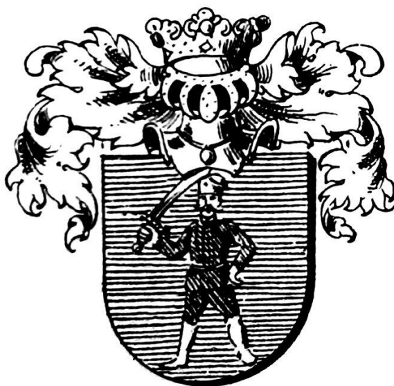
Fig. 2 – Stema conferită lui Gheorghe, Nicolae și Ladislau Sztoika alias Boer din Veneția de Jos (Iernut, 27 septembrie 1663) – după L.Ș. Szemkovics