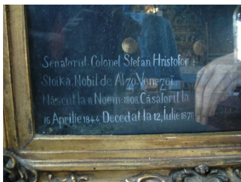
Fig. 20 – Inscripția portretului colonelului Ștefan Stoika