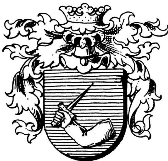
Fig. 4 – Stema conferită lui Ioan, lui Ștefan Stoika, precum și fiilor celui dintâi, Ștefan, Ladislau și Ioan din Veneția de Jos (Laxenburg, 14 iunie 1718) – după descrierea lui L.Ș. Szemkovics