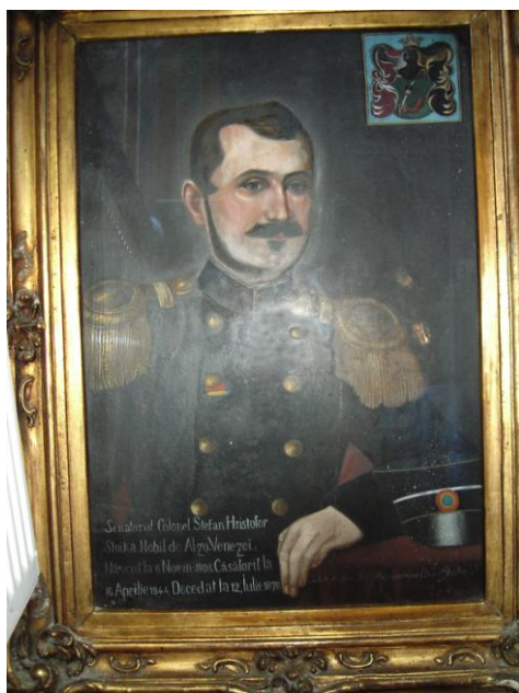
Fig. 18 – Portretul colonelului Ștefan Stoika