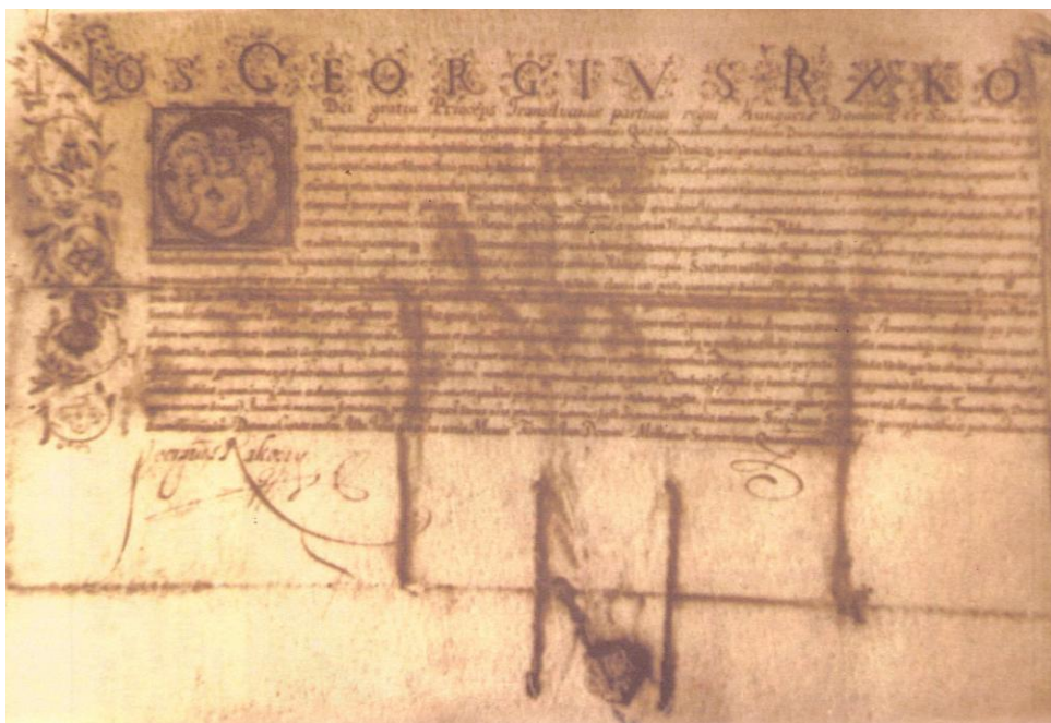
Fig. 5 – Diploma de înnobilare conferită lui Ștefan Stoika din Veneția de Jos (Alba Iulia, 3 sau 13 februarie 1649) – după Geo Călugăru