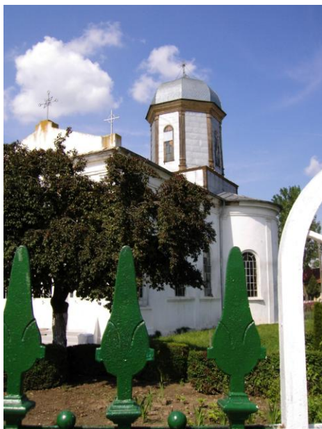
Fig. 12 – Biserica „Sfânta Treime“ din Urziceni (altă vedere de ansamblu)