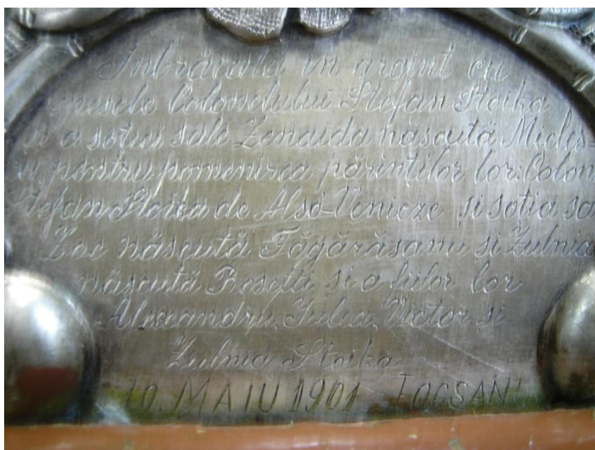
Fig. 14 – Inscripția icoanei Maicii Domnului