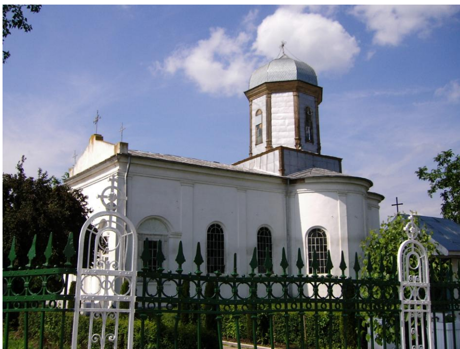
Fig. 11 – Biserica Sfânta Treime din Urziceni (vedere de ansamblu)