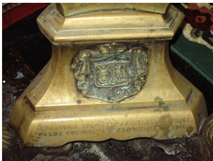
Fig. 16 – Sfeșnic împărătesc – detaliu – cu stema Principatelor Unite și inscripția amintindu-l pe donator