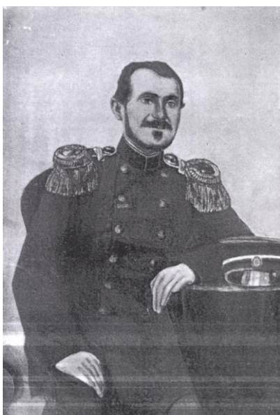
Fig. 6 – Colonelul Ștefan Stoika în uniformă – după G[eneral] N[icolae] S[toica]