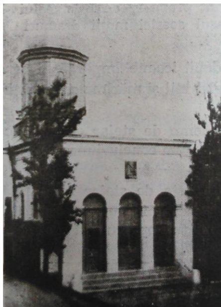
Fig. 10 – Biserica Sfânta Treime din Urziceni (cu pridvorul închis) – după Pr. Ioan Ciolca