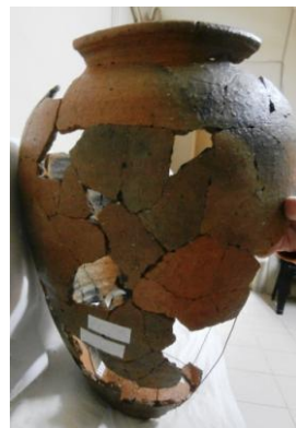
Fig. 5-6: Piesa în timpul restaurării – asamblarea și inserarea armăturilor

După asamblare a urmat completarea spațiilor goale dintre fragmentele descoperite, ce au recompus circa 65% din întreg. Completarea s-a efectuat cu ipsos de modelaj, mojarat cu pigmenți la o nuanță apropiată ceramicii. Continuarea decorului incizat pe completări s-a efectuat cu instrumentar adecvat, iar finisarea completării cu hârtie abrazivă de diverse granulații ( Fig. 7-8 ).