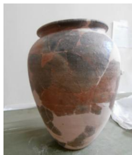
Fig. 7-8: Piesa în timpul completării formei

Conservarea și uscarea zonelor completate a încheiat procesul de restaurare al piesei.