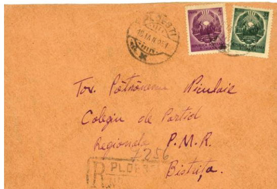
Fig. 8 – Plic adresat lui Nicolae Pătrănescu la Colegiul de partid Bistrița