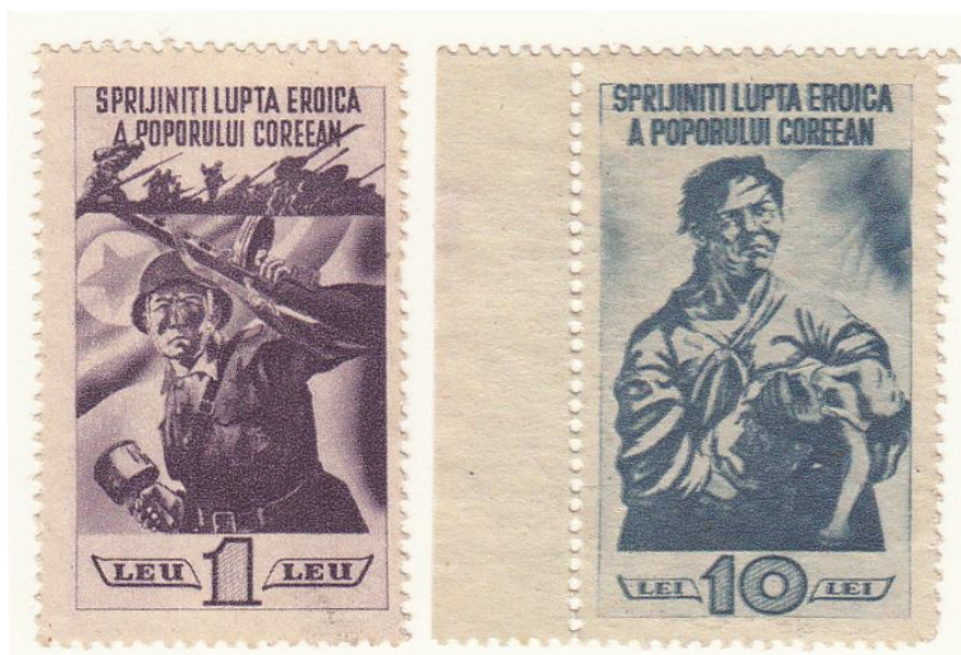
Fig. 2 – Vignete emise în sprijinul Coreei de Nord – 1949 (colecția autorului)