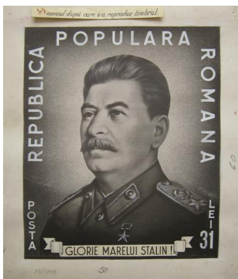
Fig. 3 – Macheta mărcii poștale I.V. Stalin – 70 de ani , 1949 (Muzeul Național Filatelic)