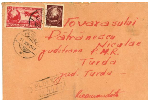
Fig. 5 – Plic adresat lui Nicolae Pătrănescu la Regionala de partid Turda