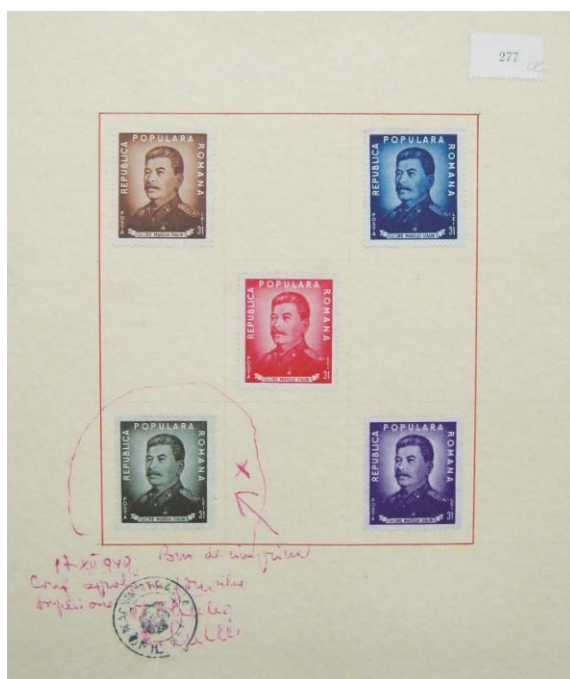
Fig. 4 – Modelar de culoare I.V. Stalin – 70 ani , 1949 (Muzeul Național Filatelic)