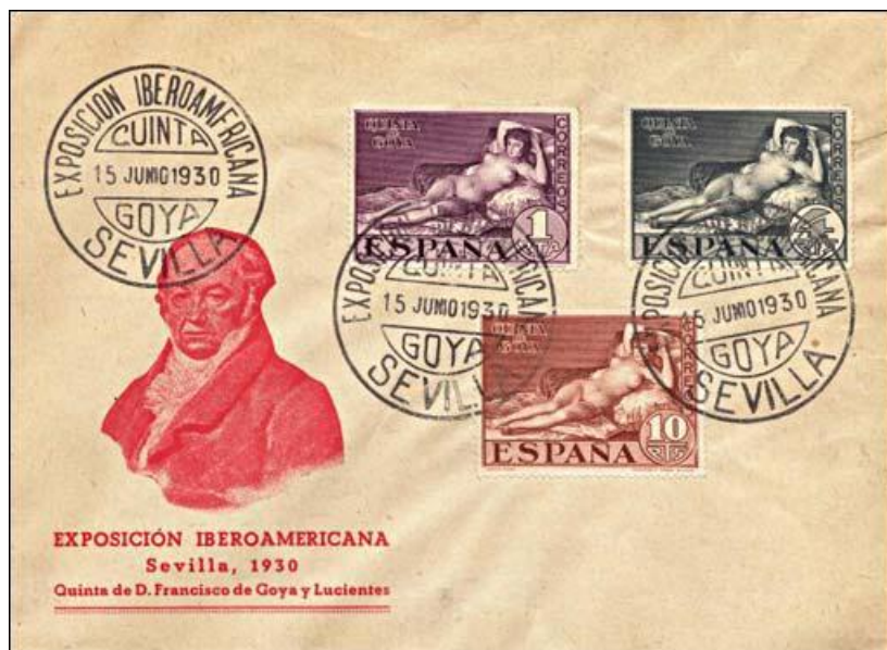
Cele trei timbre cu Maja desnuda , 1930

vreme de trei zile (15-17 iunie 1930). Dar, surpriză ! Guvernul Statelor Unite a interzis sau returnat orice scrisoare care avea lipită pe ea aceste timbre. Americanii erau atunci extrem de pudici și de puritani 8 .