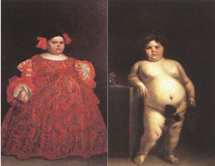
Juan Carreno de Miranda, Monstruoasa îmbrăcată și Monstruoasa dezbrăcată , cca. 1680

Cum de a îndrăznit, totuși, artistul să ofere publicului tocmai pe țitoarea prim-ministrului? În primul rând, cele două tablouri nu au fost destinate publicului. Godoy îi comandă lui Goya cele două tablouri: Maja Desnuda ( Maja dezbrăcată , cca.1800) și Maja Vestida ( Maja îmbrăcată , cca.1803), dar le-a ascuns privirilor. Mai precis le-a ascuns în cabinetul său privat timp de 6 ani, alături de Venus în oglindă a lui Velasquez (există și varianta că cele două tablouri ar fi aparținut ducesei de Alba, fiind achiziționate de Godoy după moarte ducesei!). Probabil, după Maja dezbrăcată , Godoy îi comandă lui Goya o maja îmbrăcată care să o acopere pe prima. Dar șiretiul a fost descoperit după ce Godoy și-a pierdut funcția, în 1808, tablourile fiind confiscate de regele Ferdinand al VII-lea, ele intrând apoi în proprietatea Academia de arte frumoase de la San Fernando (Madrid). În 1813, Inchiziția confiscă ambele tablouri. Probabil, în 1836, cele două tablouri au fost returnate Academiei de la San Fernando. Din 1910 ele se află la Muzeul Prado din Madrid.