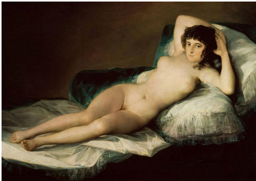
Goya, Maja desnuda , cca. 1800

Imaginea femeii goale, culcate, are o lungă și distinsă istorie în artă, însă nu în Spania unde Inchiziția făcea ravagii. De fapt, regele Carol al III-lea (1759-1788) a vrut să ardă toate nudurile din colecția regală. Se fac speculații asupra felului în care cele două maja au fost afișate în colecția lui Godoy. Unii au emis teoria că ar fi existat un dispozitiv mecanic prin care femeia îmbrăcată s-ar fi răsucit pentru a dezgoli femeia dezbrăcată de dedesubt, precum pixurile adolescenților în care, atunci când le întorci, hainele femeii cad încet. Acestea rămân totuși simple supoziții. Dar e cert că imaginea unei femei îmbrăcate lângă cea a uneia dezbrăcate produce un frison mai erotic, chiar dacă se presupune că îmbrăcând-o, îi conferi respectabilitate 4 .