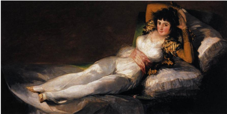
Maja vestida , cca. 1803

În 1815, Inchiziția spaniolă l-a convocat, însă, pe Goya pentru a descoperi cine i-a comandat " obscenitatea " numită ... La maja desnuda . I-a înscenat chiar un proces. Artistul s-a salvat făcând referință la Velasquez, pictorul favorit al lui Filip al IV-lea. A susținut că a fost impulsionat de Venus în oglinda a lui Velasquez și că astfel ar fi urmat o anume ... tradiție. Adevărul este că, deși Maja desnuda prezintă anumite similitudini cu Venus în oglindă , ea se deosebește de aceasta prin poziția trupului, expresivitate și modernitate. La Velasquez, goliciunea întoarsă la noi era parca surprinsă pe furiș. Goya prezintă goliciunea fățiș, aproape provocator. Și ceea ce era cu adevărat important, Velasquez crease o pictură mitologică, ceea ce nu era deloc cazul cu tabloul lui Goya. Artistul nu a avut de suferit, totuși, prea mult, dar a fost deposedat de poziția sa de pictor al Curții spaniole, poziție obținută în 1789. A scăpat destul de ieftin și datorită faptului că cel care a inițiat procesul, cardinalul Luis Maria de Borbon y Vallabriga, era fratele soției lui Manuel Godoy 7 . Cardinalul, adevăratul conducător al Spaniei după restaurația puterii absolute a lui Ferdinand al VII-lea, din 1814 și până la revoluția lui Rafael Riego din 7 martie 1820, a fost destul de îngăduitor cu marele artist.