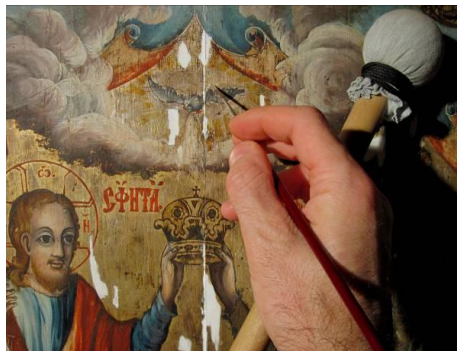
Fig. 12 – Integrarea cromatică a uzurilor stratului pictural