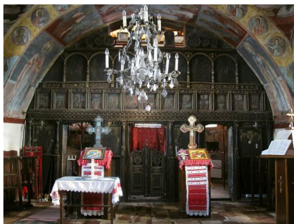
Fig. 2 – Iconostasul înainte de restaurare. Icoana de hram se află în dreapta registrului icoanelor împărătești