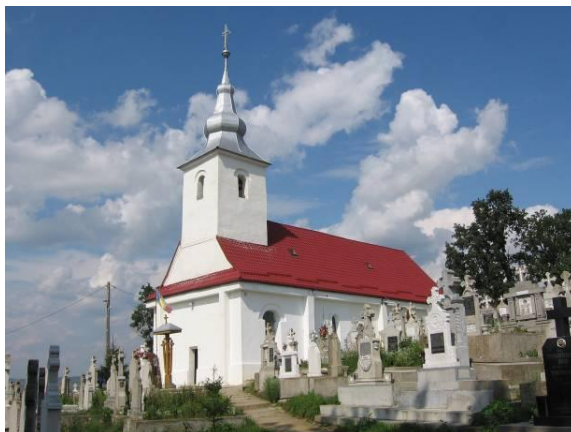
Fig. 1 – Biserica Sfânta Treime din satul Mândra. Vedere dinspre sud-vest