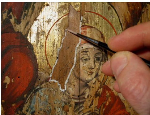
Fig. 9 – Tivirea marginii stratului pictural