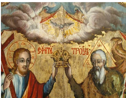
Fig. 14 – Sfânta Treime, detaliu după integrarea cromatică