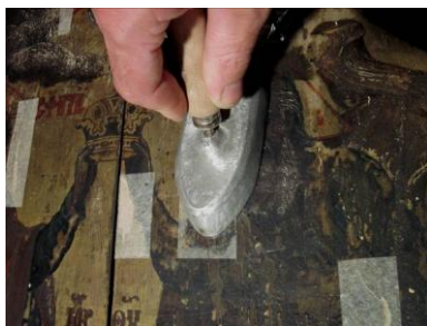
Fig. 3 – Consolidarea stratului pictural exfoliat