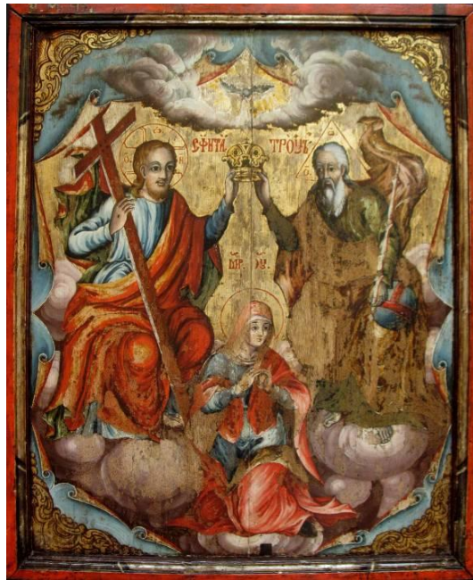
Fig. 16 – Icoana de hram Sfânta Treime . Imagine după restaurare