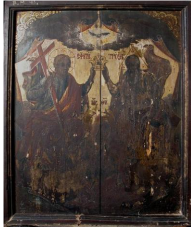
Fig. 15 – Icoana de hram Sfânta Treime . Imagine înainte de restaurare