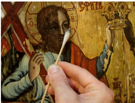
Fig. 7 – Curățarea selectivă, pe zone compoziționale