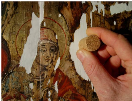
Fig. 11 – Aducerea la nivel și șlefuirea chituirilor