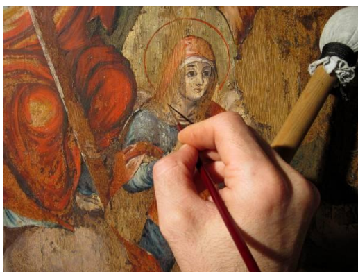
Fig. 13 – Integrarea cromatică a suprafețelor chituite