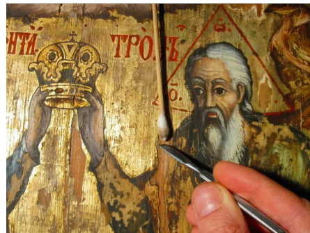
Fig. 8 – Curățarea și degresarea lacunelor stratului pictural