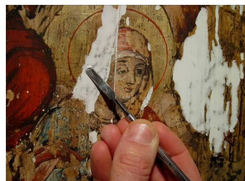
Fig.10 – Chituiră lacunelor stratului pictural