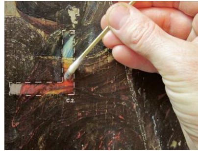
Fig. 6 – Test extins de curățare a murdăriei aderente