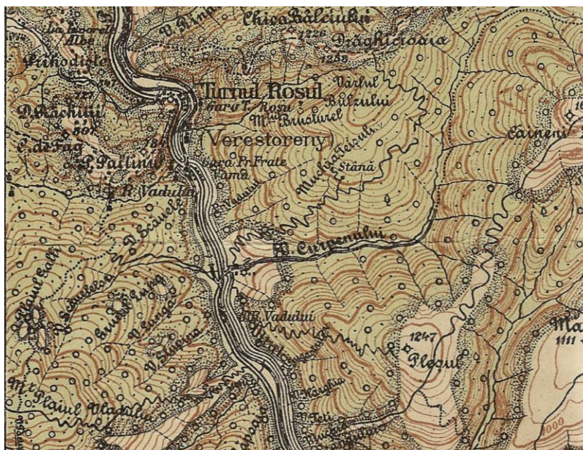
Fig. 2 – Harta întocmită de Serviciul Geografic al Armatei, Râul Vadului și Racovița, scara 1: 100.000