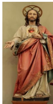
Inima lui Iisus

Statuile sunt din lemn și au fost achiziționate din Tirol (Austria) la începutul anilor 1900.