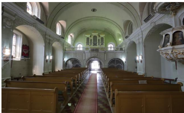
Naosul – vedere generală de la altar