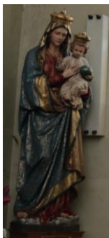
Sf. Fecioară cu pruncul Iisus