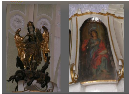
Îngerul Mihail luptând cu diavolul; Christos cu crucea și gloriola