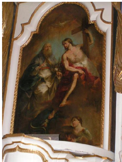
Pictura din centrul altarului: Sfânta Treime