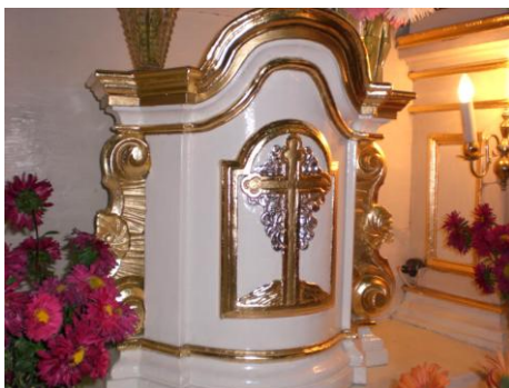
Tabernacol: vedere apropiată