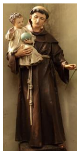
Sf. Anton de Padova (1195-1231)

Papa Pius al X-lea, care a început procesele canonice, a prevăzut că va fi recunoscută drept ”cea mai mare sfântă a timpurilor moderne” .