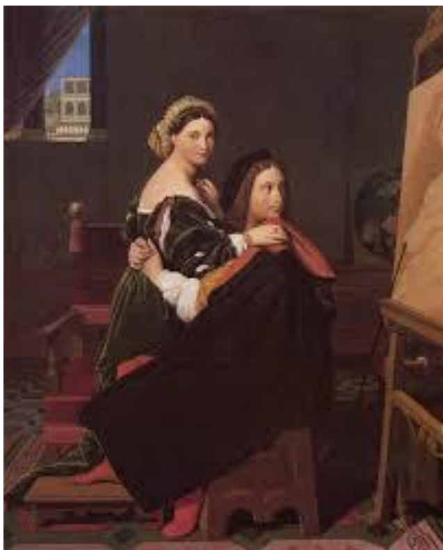
Rafael și Margarita, pictura din 1814 a lui Ingres

Tabloul La Fornarina a avut detractori, dar și admiratori. În 1618, Fabio Chigi, urmașul lui Agostino Chigi, va spune că tabloul ” este mediocru și reprezintă o prostituată de joasă speță ” 4 . În anul 1814, însă, artistul francez Jean-Auguste-Dominique Ingres a pictat-o pe ” fica brutarului ” așezată pe genunchii lui Rafael. Părea că artistul francez a intuit dragostea celor doi.