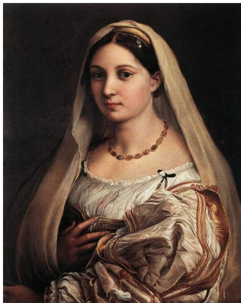
La Fornarina (1520) și La Donna Velata (1516)