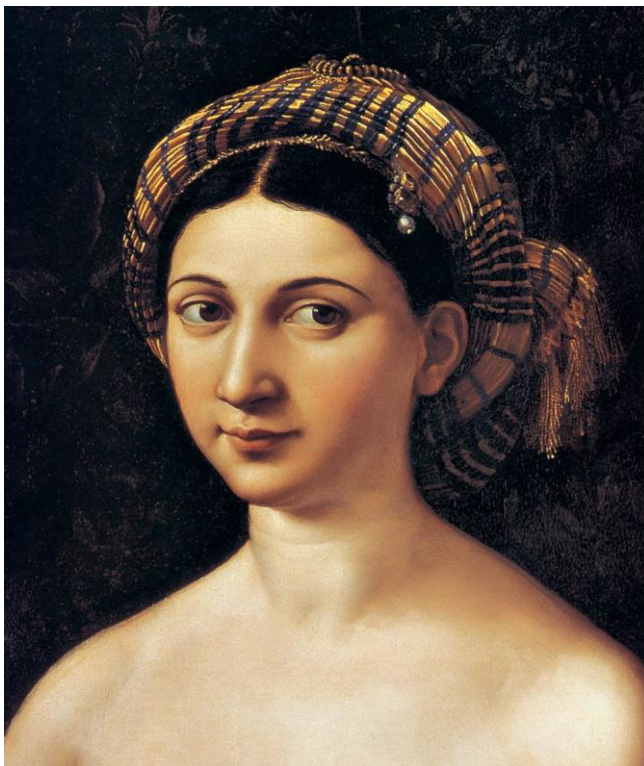
"Fornarina" are o perlă prinsă de turban

"Velata"/vălul. Femeia cu vălul indică faptul că este ... căsătorită. Ținuta ei spune asta. Are și ea celebra perlă în păr. Și poziția mâinii stângi este aproape identică cu cea din La Fornarina .